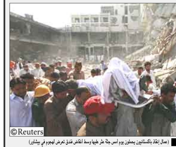
عمال إنقاذ باكستانيون يحملون يوم أمس جثة رجل عليها رصاصة أثناء فتح فندق تعرض للهجوم في بيشاور