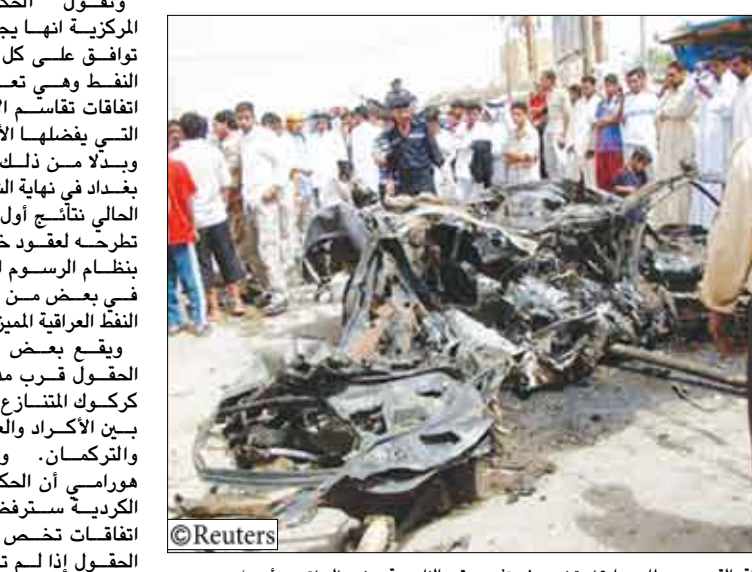
سكان ورجال شرطة بالقرب من حطام سيارة استخدمت في تفجير وقع بالناصرية بجنوب العراق يوم أمس

بغداد/14 أكتوبر/رويترز: ذكر مستوطنون إن 32 شخصاً على الأقل قتلوا وأصيب 70 آخرون يوم أمس الأربعاء عندما انفجرت سيارة ملغومة في سوق مزدهرة بجنوب العراق. وأغلقت الشرطة بلدة البطحاء التي تسكنها غالبية من الشيعة وتقع على بعد 30 كيلومترا إلى الغرب من الناصرية والتي لم تشهد الكثير من أعمال العنف وطلب مسئولو الاستخبارات من المدن المجاورة مساعدتهم في علاج المصابين. وقال العقيد عزيز العتابي مدير الإعلام في الفرقة العاشرة للجيش العراقي إن 32 قتلوا وأصيب 70. وأظهرت صور نشرها صحفيون محليون على الانترنت السيارة الملغومة المحترقة وأشلاء متفحمة وملابس مزقة مخضية بالدماء وقد تناثرت وسط الخضضرات المبعثرة على الأرض.