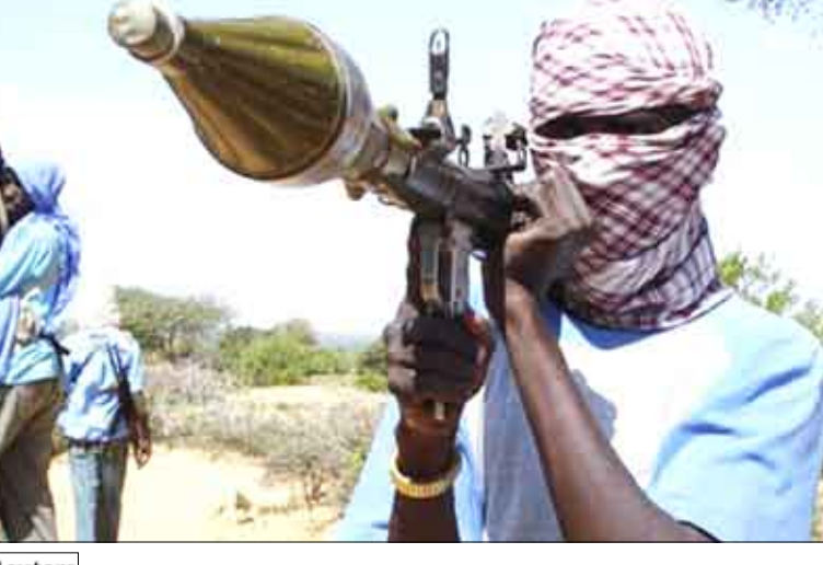
أحد المتمردين يحمل قاذفة صواريخ خارج مقديشو