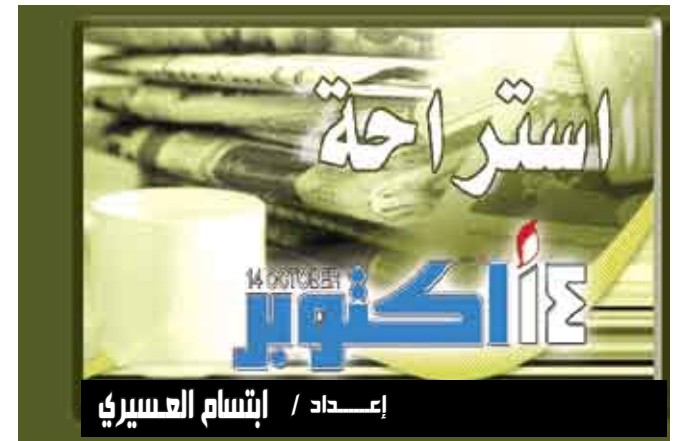
إعداد / إنشام العسيري

القاهرة/متابعات: أعلنت الجامعة الأمريكية بالقاهرة أمس الثلاثاء حالة استنفاير بإعلانها تعليق الدراسة فيها لمدة أسبوع بناء على تعليمات صدرت إليها من وزارة الصحة المصرية التي رأت ضرورة اتخاذ هذا الإجراء الوقائي بعد اكتشاف 5 إصابات جديدة بإنفلونزا الخنازير بين الطلاب تضاف إلى الحالتين التي تم التأكد منها الإثنين، فيما تم احتجاز طفلة مصرية وشقيقتها وأولادها في مطار القاهرة للاشتباه في إصابتهم بفيروس انفلونزا الخنازير لدى وصولهم من إيطاليا، كما تم عزل ماليزي قادم من السعودية. وتسود حالة من القلق بين الطلاب وموظفي الجامعة، خشية أن يكون عدد المصابين أكثر من ذلك، خاصة أن منطقة الزمالك من أرقى أحياء القاهرة وتغتن فيها نخبة من المجتمع. وكانت وزارة الصحة المصرية وضعت جميع طلاب السكن