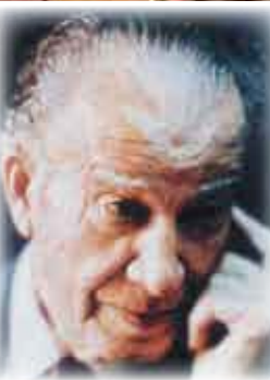
الشاعر/ عمر ابو ريشة