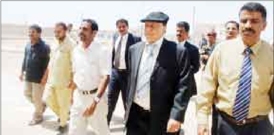
نائب الرئيس لدى وصوله مدينة الغيظة أمس