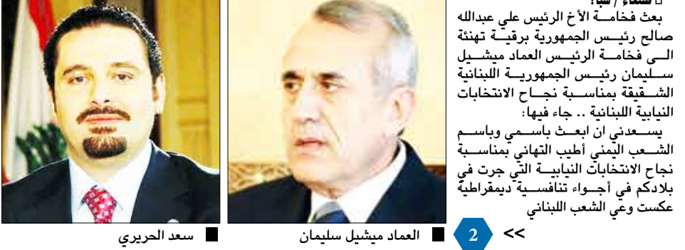
سعد الحريري | العماد ميشيل سليمان

صنعاء / سيا : بعث فخامة الأخ الرئيس على عبدالله صالح رئيس الجمهورية بريقة تهنئة الى فخامة الرئيس العماد ميشيل سليمان رئيس الجمهورية اللبنانية الشقيقة بمناسبة نجاح الانتخابات النيابية اللبنانية .. جاء فيها : يسعدني ان ابعث باسمي وباسم الشعب اليمني أطيب التهاني بمناسبة نجاح الانتخابات النيابية التي جرت في بلادكم في أجواء تنافسية ديمقراطية عكست وفي الشعب اللبناني