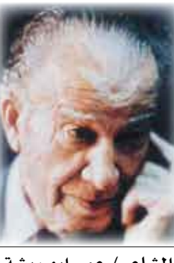
الشاعر/ عمر ابو ريشة

هنا في موسم الورد تلاقينا بلا وُعد وسرنا في جلال الصمت فوق مناكب الخُلد وفي العاطفنا جوع على الحرمان يستجدي! وأهوى جيدك الريان منكئاً على زندي فكنا غفوة خرساء بين الخُدد والخُدد مُنسى قلبي أرى قلبك لا يبقى على عُهد أسائل عنك أحلامي وأسكنها عن الرُدد أردت فقلت ما أُملت