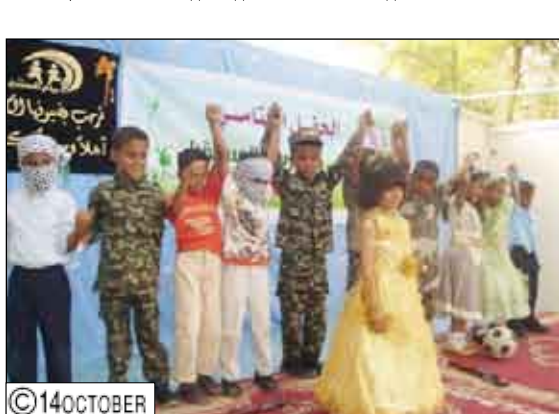
اختتمت رياض ومدارس المستقبل بمدينة سيئون العام الدراسي 2008/2009م...