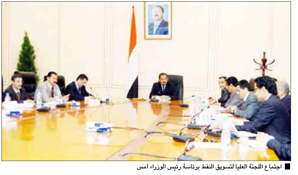
اجتماع اللجنة العليا لتسويق النفط برئاسة رئيس الوزراء أمس

أقرت اللجنة العليا لتسويق النفط الضام أمس مبيعات شهر أغسطس المقبل من نفط المسيلة الضام والبالغ قيمتها مليوناً و400 ألف برميل فيما أقرت السعر الرسمي للبرميل الواحد وفقاً لأفضل عرض مقدمة شركة (بي. بي) والمحدد بربط المؤرخ زائد 50 سنتاً. وخلال اجتماعها الذي عقده أمس برئاسة الدكتور علي محمد مجور، رئيس الوزراء، قررت اللجنة عرض 500 ألف برميل من نفط سائب الخام في السوق العالمية ابتداءً من دورة أغسطس المقبل وذلك ضمن إجمالي الكمية المتاحة سواء في هذه الدورة أو الدورات اللاحقة بهدف إبقائه في حيز التداول بالسوق النفطية العالمية بما يعزز سمعة الخام والقدرة على تسويقه والحصول على أسعار أفضل من خلال عرض الكمية على أكبر عدد من المشترين. وعبرت اللجنة عن ارتياحها لتطور المستمر الذي تشهده عملية التسويق للنفط الخام، وشددت على ضرورة التركيز خلال الفترة القادمة على استقطاب شركات جديدة بما يواكب المتغيرات الحالية في تسويق النفط الخام عالمياً مع الأخذ بعين الاعتبار الالتزام والتطوير المستمر بمعايير الشفافية في جميع الأعمال المرتبطة بهذه العملية.