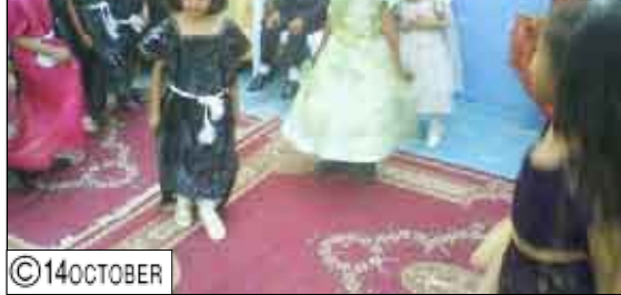
اختتمت رياض ومدارس المستقبل بمدينة سيئون العام الدراسي 2008/2009م...