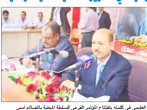
العليمي في كلمته بافتتاح المؤتمر الفرعي للسلطة المحلية بالضالع أمس

افتتح المؤتمر الفرعي للسلطة المحلية بمحافظة الضالع أمس، بحضور رئيس الوزراء الدكتور رشاد العليمي، نائب رئيس الوزراء لشؤون الدفاع والامن وزير الادارة المحلية إلى مرحلة الحكم المحلي يمثل نقلة نوعية في تطوير العملية الديمقراطية وإدارة العملية التنموية في الوحدات الإدارية والتي حققت نجاحاً كبيراً في الفترة ما بين (2003 - 2008). وفي كلمته بافتتاح المؤتمر الفرعي الموسع للسلطة المحلية بمحافظة الضالع أمس، أوضح العليمي أن الانتقال إلى الحكم المحلي يشكل أحد الأهداف الرئيسية لهذا المؤتمر، وقال: "ما تحقق من منجزات في كافة محافظات الجمهورية ومنها محافظة الضالع كبرى وأهمها على مختلف الأصعدة، وننتقل إلى مزيد من المنجزات وخاصة مجال التنمية والاستثمار والتي تتطلب مزيداً من الأمان والاستقرار وتحسين الأداء الإداري على مستوى السلطتين المركزية والمحلية". وأكّد العليمي ان التوضيحات الجسيمة التي قدمها أبناء الضالع إلى جانب إخوانهم بكافة المحافظات أثمرت الكثير من النتائج على كافة المستويات منها المؤتمر الفرعي، وقال: "ان وفائنا لشهداء المحافظة وكل الشهداء اليمينين أن نحافظ على المبادئ والأهداف التي قدموا أرواحهم من أجلها".