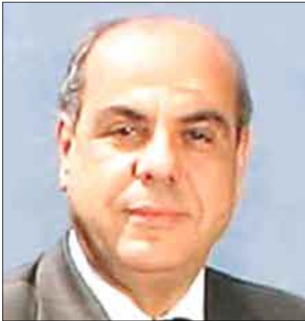
رئيس الاتحاد الجزائري

وقال بعد نهاية المباراة «خسارتنا للمباراة أمام الجزائر كانت منطوية. الهدف الأول أثر كثيراً في اللاعبين، أما الهدف الثاني فحضى عليهم تقريباً». وأكد شحاتة أن المباراة المقبلة ضد رواندا في الجولة الثالثة من التصفيات ستكون حاسمة، قائلا «يجب الفوز بها وإذا حدث العكس فسنضيق حلم التأهل إلى المونديال». يذكر أن مصر لم تتمكن من الفوز على الجزائر على أرضها خلال 11 مباراة جمعت بينهما.