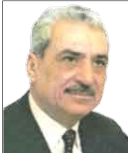
الشاعر / توفيق زياد

أجيبيني !! أُنْبَادِي جَزْحُكَ الْمَلُوءِ مَلِحًا يَا فَلَاطِينِي أُنَادِيهِ وَأَصْرُخُ : ذُوبِينِي فِيهِ .. صِينِينِي أَنَا أَيْشُكُ ! خَلْفْتِي مَا هُنَا الْمَأْيَسَةُ .. عِنْفًا تَجْتُ سَكِينُ . أَعِيشْ عَلَى خَفِيفِ الشُّوقِ .. فِي غَابَاتِ زَيْتُونِي . وَأَكْتَسِبِ الصَّعَالِيكَ القَضَائِدَ سَكْرًا مَرًّا . وَأَكْتَبِ الْمَسَاكِينِ . وَأَغْمِسْ رِيشَتِي ، فِي قَلْبِ قَلْبِي ، فِي شَرَابِيْنِي . وَأَكَلِ حَاطِطِ الْفُولَادِ .. وَأَشْرِبْ رَيْحَ تَشْرِينِ . وَأَدْمِي مُعْتَصِبِي