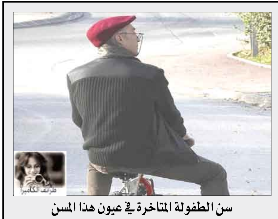
سن الطفولة المتاخرة في عيون هذا المسن

حالة نفسية سيئة وانه قام بذك بخلق خوفاً عليها من الفقر والذل الذي سيذهبونه في الدنيا.