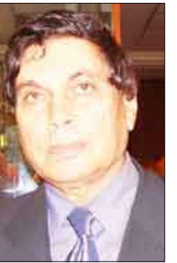
■ سفير الجامعة العربية بموسكو