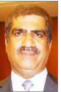
■ سفير الجامعة العربية بموسكو