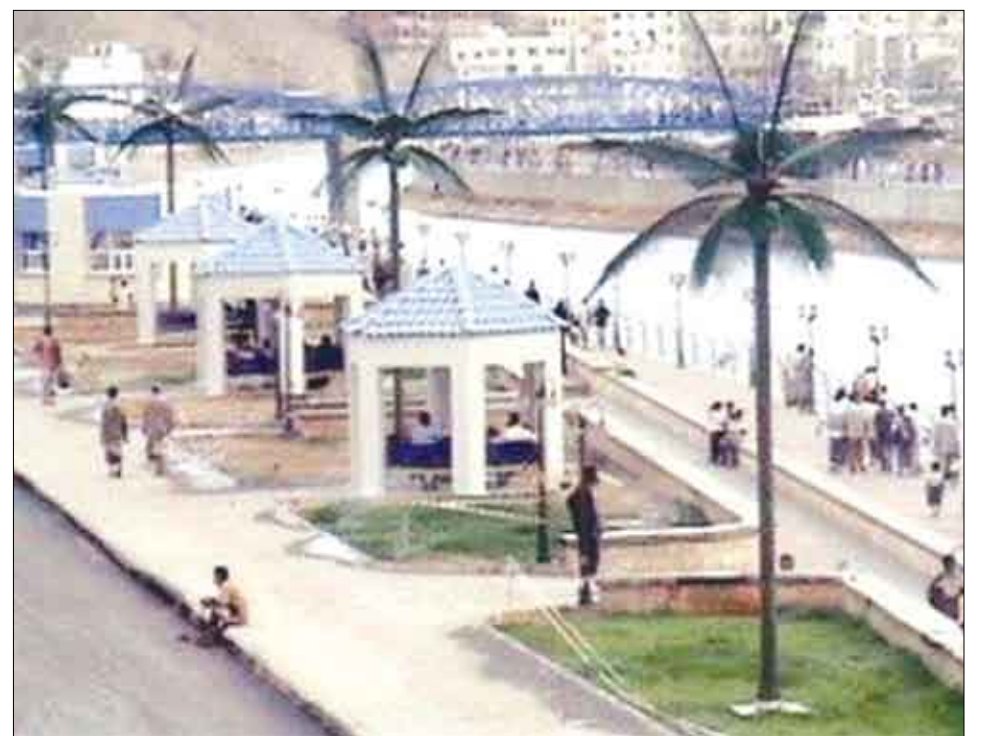
منظر عام من حضرموت

والكهرباء والمياه والصرف الصحي والأشغال العامة والطرق والاتصالات والتربية والتعليم والصحة والسكان والأمن والدفاع والشباب والرياضة والأوقاف والإرشاد والثقافة تقدر بـ ( تسعين مليار وثمانمئة وثلاثة وأربعين مليون ومائتين وأربعة وسبعين ألف وسبعمائة واثنين وثلاثين ريالاً ) وفيما يتعلق بالأضرار التي لحقت بمنزل المواطنين فقد بلغ عدد المنازل التي تهدمت تهديما كليا ( 1433 ) منزلا ( 936 ) منزلا تهدم بشكل جزئي ووصل عدد الأسر المتضررة من الكارثة ( 4129 ) أسرة تضم ( 23332 ) نسمة في مديريات ( تريم وساه والقطن والسوم وحوارة ووادي العين وشيخام وسيئون ) ونسعى نحن في السلطة المحلية وبالتنسيق مع الحكومة البدء في المشاريع العاجلة التي تضمنتها خطط الأعمار لما دمته الكارثة الطبيعية الماضية في وادي حضرموت وفي المقدمة منها العمل السريع على تهيئة مجاري السيول والبدء ببناء المساكن الجديدة للمتضررين فضلا عن معالجة الأضرار التي نجمت في القطاع الزراعي . مضيفا بان اليمن بإعادة تحقيق وحدته المظفرة دخل عهدا زاهايا التام فيه الشمل اليمني بين أبناء الوطن الواحد من الشرق إلى الغرب ومن الجنوب إلى الشمال بعد أن كان يعيش ظروف التمزق والفرقة لفترات طويلة من الزمن .. وتعزز بالوحدة الزخم التنموي المستمر على شكل خطط وبرامج تنموية واقتصادية وفتح الآفاق الواسعة والرحبة للحرية والاستقرار والتعددية السياسية وحرية الرأي والرأي الآخر ونال الإنسان اليمني العزة والشموخ والحقوق في ظل الأمن والاستقرار. إننا نؤكد هنا على ضرورة مواجهة الممارسات والسلوكيات الخاطئة التي يسلكها البعض ممن يوهمون أنفسهم ويوهمون البسطاء من أبناء هذا الوطن بالعودة إلى عهود التمزق والتشرذم .. ونحن على