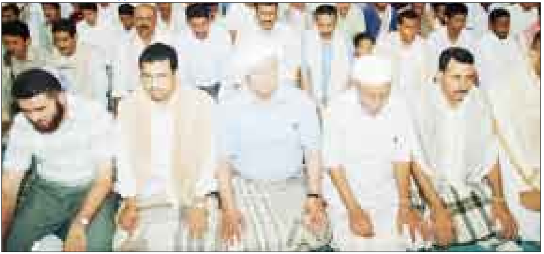
نائب الرئيس يؤدي صلاة الجمعة في جامع الخير بعدن أمس

عدن/ سبأ : أدى الأخ عبدربه منصور هادي نائب رئيس الجمهورية يوم أمس صلاة الجمعة مع جموع المصلين في جامع الخير بمدينة خور مكسر محافظة عدن. حيث استمع إلى خطبتي الجمعة اللتين تركزت حول المعاني العظيمة والمكانة الرفيعة لديننا الإسلامي والمفاهيم الاجتماعية والثقافية والإنسانية التي تهم المجتمع في مختلف مناحي الحياة. ونوه الخطيب إلى القيمة الإنسانية والدينية والأخلاقية لتلك الجوانب ومن بينها مفهوم الأمانة والمكانة الدينية والاجتماعية لها وحفظها والدلالة الكبيرة التي تمثلها هذه المسألة العظيمة بكل دلالاتها وأبعادها ومكانتها في الحياة. وأكد الخطيب على أهمية تعليم اولادنا سلوكيات الدين الإسلامي ومفاهيمه القيمة من أجل التربية الحسنة والحياة الكريمة التي يجب أن يكون أساسها الأمانة في القول، والفعل، والدين والسلوك. وتوجه الخطيب بالدعاء إلى الله تعالى أن يجنب اليمن وأهلها الشيطان والرفقة وخائني الأمانة ومعوجي السلوك.