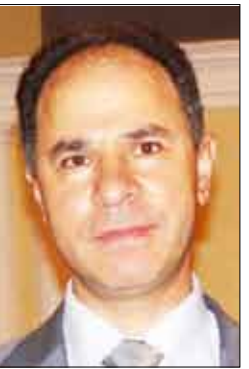
■ سفير الجامعة العربية بموسكو