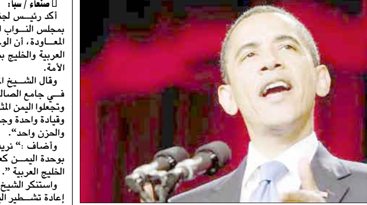
الرئيس الأمريكي باراك أوباما أثناء ألقائه كلمته إلى العالم الإسلامي من جامعة القاهرة أمس الأول الخميس

عدن/ سبأ : عبر مصدر مسؤول في الحكومة اليمنية عن ترحيب الجمهورية اليمنية بخطاب الرئيس الأمريكي باراك أوباما في القاهرة والموجه إلى العالم الإسلامي والعربي. ووصف الخطاب بالتوازن في فحواه وفيما عبر عنه تجاه الدين الإسلامي والصراع العربي الإسرائيلي وبالذات تمسكه بحل الدولتين الفلسطينية والإسرائيلية ووقف بناء المستوطنات واعترافه بحق الفلسطينيين ومعاناتهم وإن أمن إسرائيل مرتبط بحل عادل للصراع العربي الإسرائيلي . وقال المصدر لوكالة الأنباء اليمنية سبأ : "يقدر ما تراه الجمهورية اليمنية من تغيير إيجابي في الموقف الأمريكي من خلال تذكير على ضرورة ترجمة هذه المبادئ إلى حقائق على أرض الواقع من خلال تدعيم مباحثات السلام الفلسطينية - الإسرائيلية على أساس المبادرة العربية للسلام ووقف بناء المستوطنات وإزالتها وإنهاء الحصار الإسرائيلي الجائر على أبناء الشعب الفلسطيني في قطاع غزة". كما عبر المصدر عن أمه في صياغة علاقات بين الغرب والعالم الإسلامي مبنية على الاحترام المتبادل والمصالح المشتركة بعيداً عن الغرض أو نظرية صراع الأديان مؤكداً أن العالم العربي والإسلامي سيتعامل بإيجابية مع كل ما يحقق السلام العادل والشامل في المنطقة.