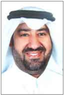
■ سفير الجامعة العربية بموسكو