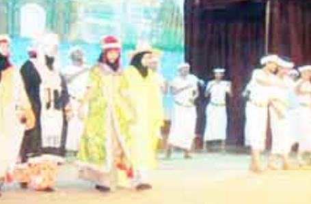
لقطة فنية من الحفل

الجبلي أن الوحدة أعظم منجز تاريخي تحقق للشعب اليمني والأمتين العربية والإسلامية في العصر الحاضر