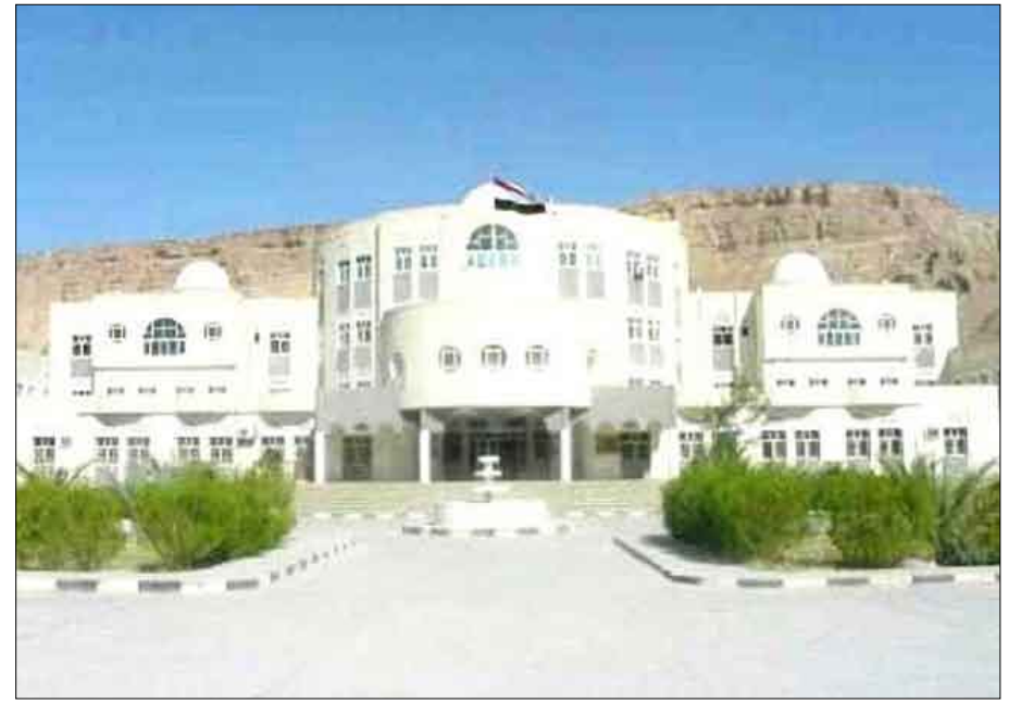
المجمع الحكومي بسيئون

وكيل محافظة حضرموت لشؤون مديريات الوادي والصحراء لـ (الكنوبور):