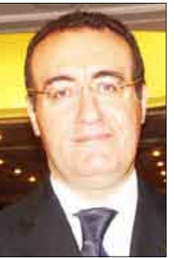
■ سفير الجامعة العربية بموسكو