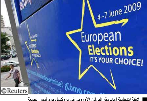
لافتة انتخابية أمام مقر البرلمان الأوروبي في بروكسل يوم أمس الجمعة

الرئيسية في كتلة بين الوسط مقاعد على الرغم من بقاء الحزب المسيحي الديمقراطي متقدما بخمس مقاعد عن حزب الحرية. ومن المتوقع في بريطانيا أن لا يحقق حزب العمال الحاكم نتائج طيبة بعد الفضيحة الخاصة بنفقات بعض الوزراء وكذلك الأزمة الاقتصادية. وليس من المتوقع أن تتغير تشكيلة البرلمان الأوروبي فأعضاؤه البالغ عددهم 736 عضواً يشكلون بقرون العديد من قوانين الاتحاد الأوروبي وهو يعمل كمراقب للديمقراطية على المؤسسات الأخرى كما أنه يقر ميزانية الاتحاد الأوروبي. وفي هولندا رجحت استطلاعات الرأي خارج مراكز الاقتراع فوز حزب الحرية الذي يتزعمه خيرت فيلدرز بالمركز الثاني وحصوله على أربعة من 25 مقعداً مخصصة لهولندا بينما لم يفز الحزب بأي مقاعد في البرلمان السابق. وأشارت استطلاعات الرأي أيضاً إلى خسارة الأحزاب