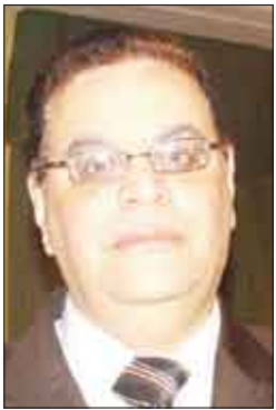
■ سفير الجامعة العربية بموسكو