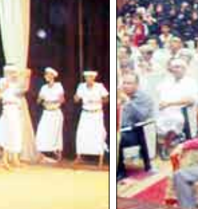
الجبلي أثناء حضوره الحفل الخطابي والفني في محافظة الحديدة أمس

الجبلي أن الوحدة أعظم منجز تاريخي تحقق للشعب اليمني والأمتين العربية والإسلامية في العصر الحاضر