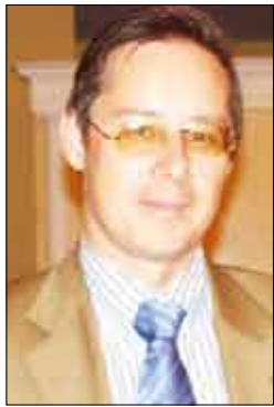
■ سفير الجامعة العربية بموسكو