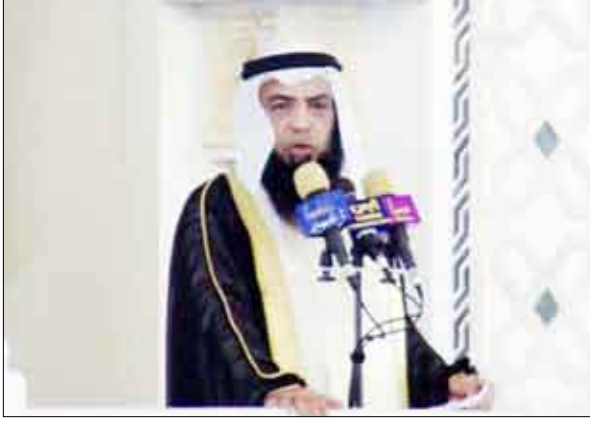
الشيخ عادل المعاودة أثناء الفاء خطبتي الجمعة في جامع الصالح بصنماء أمس

عدن/ سبأ : أكد رئيس لجنة الشؤون الخارجية والدفاع والأمن الوطني بمجلس النواب البحريني فضيلة الشيخ عادل بن عبد الرحمن المعاودة، أن الوحدة اليمنية بقدر ما تمثل قوة ودعماً للمنطقة العربية والخليج بشكل خاص، فإنها في ذات الوقت نواة لوحدة الأمة. وقال الشيخ المعاودة في خطبتي الجمعة اللتين ألقاهما أمس في جامع الصالح بصنماء... ندعوكم أن تحذروا بوحدة اليمن وتجعلوا اليمن المثال الذي يجب أن يحذروا به، بلد واحد وشعب واحد وقيادة واحدة وجيش واحد واقتصاد واحد والمهم واحد والفرح واحد والحزن واحد". وأضاف: " نريد أن نكون كاليمن وتتوسع هذه الوحدة وينبأها بوحدة اليمن كعضو كامل العضوية في مجلس التعاون لدول الخليج العربية". واستنكر الشيخ المعاودة بشدة الأصوات النشاز التي تسعى إلى إعادة تشطير اليمن . وقال: إن هذه الدعوى دعاوى فاجرة أقولها صراحة وليست في مصلحة اليمن .