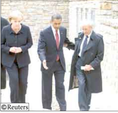
لا دريسدن (ألمانيا) / 14 أكتوبر / رويترز:

وأكد أوباما «أن الوقت قد حان الآن لنا كي نتحرك بشأن ما نعرف جميعاً أنه الحقيقة وهو أن كل طرف سيكون عليه أن يقدم تنازلات صعبة». وبعد دريسدن قام أوباما بجولة في معسكر بوشفالذ وإحياء ذكرى ضحايا محرقة النازي. الزيارة سترسل رسالة إلى القدس مفادها أنه وإن لم يزر إسرائيل في جولته الأولى في الشرق الأوسط فإن أمن إسرائيل مازال شاملاً محورياً في السياسة الخارجية الأمريكية. وقال أوباما بينما كانت المستشارة الألمانية أنجيلا ميركل بصحبته ويقف خلفه إيلي ويزل وتراند هرتز الناجيان من المعسكر «حتى اليوم نعرف أن هناك من يصرون على أن المحرقة لم تحدث أبداً وهو إنكار لواقع ولحقيقة أساس له جاهل وبيغض وهذا المكان هو الراد الحاسم على مثل هذه الأفكار». وكان أوباما قد أعطى لحل الصراع الإسرائيلي الفلسطيني أولوية في سياسته الخارجية وانغمس منذ بداية ولايته في سياسات الشرق الأوسط. ولم تولج أوباما بشعبية جارة في ألمانيا ولكن وإلى جانب مشكلة الشرق الأوسط ناقش أوباما مع ميركل موقف البلدين من المواجهة مع إيران بسبب برنامجهما النووي والأزمة المالية العالمية والتغير المناخي ومصير المعتقلين في معسكر جواتانامو.