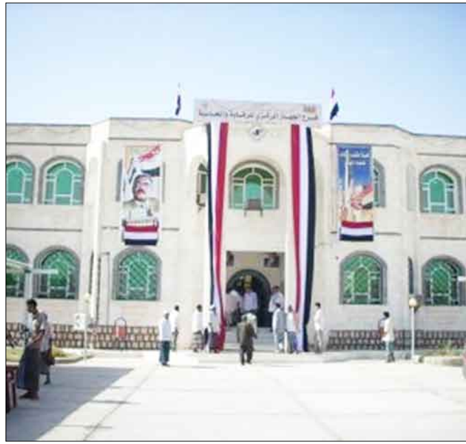
مبنى الجهاز المركزي بسيئون