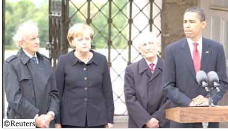
الشرق الأوسط وأوروبا قال أوباما «أنا واثق في أننا إذا ثابرتنا... يمكننا أن نحقق بعض التقدم الجاد هذا العام».

وأكد أوباما «أن الوقت قد حان الآن لنا كي نتحرك بشأن ما نعرف جميعاً أنه الحقيقة وهو أن كل طرف سيكون عليه أن يقدم تنازلات صعبة». وبعد دريسدن قام أوباما بجولة في معسكر بوشفالذ وإحياء ذكرى ضحايا محرقة النازي. الزيارة سترسل رسالة إلى القدس مفادها أنه وإن لم يزر إسرائيل في جولته الأولى في الشرق الأوسط فإن أمن إسرائيل مازال شاملاً محورياً في السياسة الخارجية الأمريكية. وقال أوباما بينما كانت المستشارة الألمانية أنجيلا ميركل بصحبته ويقف خلفه إيلي ويزل وتراند هرتز الناجيان من المعسكر «حتى اليوم نعرف أن هناك من يصرون على أن المحرقة لم تحدث أبداً وهو إنكار لواقع ولحقيقة أساس له جاهل وبيغض وهذا المكان هو الراد الحاسم على مثل هذه الأفكار». وكان أوباما قد أعطى لحل الصراع الإسرائيلي الفلسطيني أولوية في سياسته الخارجية وانغمس منذ بداية ولايته في سياسات الشرق الأوسط. ولم تولج أوباما بشعبية جارة في ألمانيا ولكن وإلى جانب مشكلة الشرق الأوسط ناقش أوباما مع ميركل موقف البلدين من المواجهة مع إيران بسبب برنامجهما النووي والأزمة المالية العالمية والتغير المناخي ومصير المعتقلين في معسكر جواتانامو.