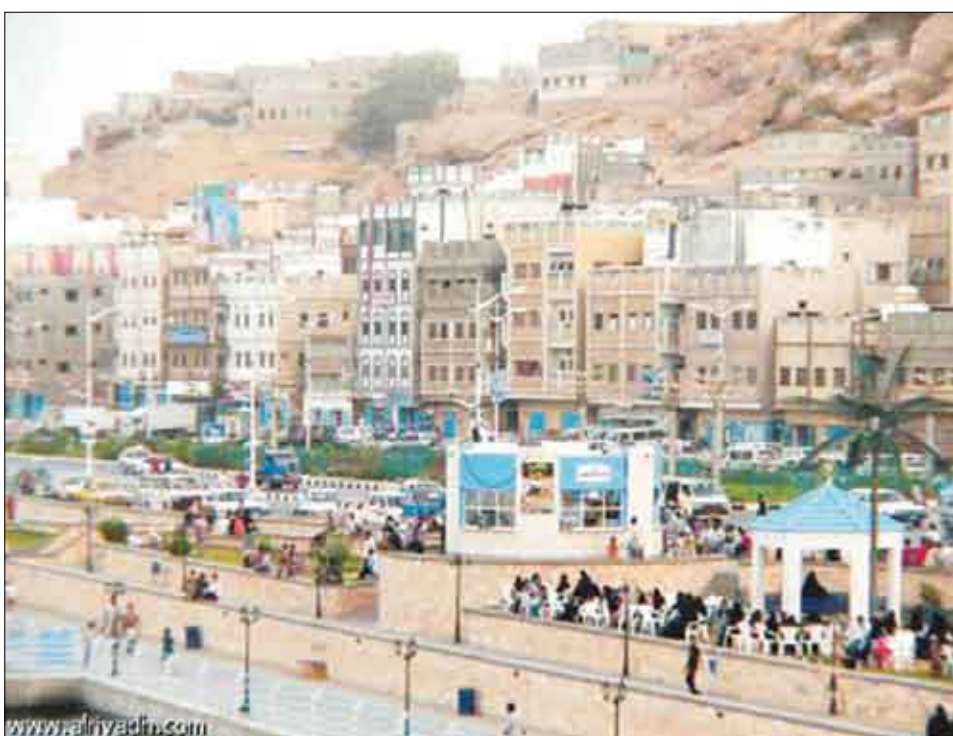
منظر عام من المكلا

بان تلك الممارسات حتما ستدوب بالفضل الذريع وستسقط مهزومة على صخرة الوحدة النبوية التي تحطمت عليها كل المؤامرات وستتكسر أمام وفاء شعبنا الأبي لمبادئه وثورته الجيدة وأمام الثوابت الوطنية التي يستحيل التخلي عنها كونها الطريق المنير إلى دروب المستقبل الأجل لليمن الواحد الموحد .. أن الثورة والجمهورية والوحدة والديمقراطية ثوابت وطنية لا يمكن التبتة أن تحيد عنها قيد أنملة .. وإن الوحدة راسخة وقوية رسوخ الجبال الشامخة والتراجع عنها جريمة كبرى .. لذلك فمن الواجب علينا التصدي وبحزم أمام كل الأعمال التخريبية الخارجة عن الدستور والقانون ومحاربة ثقافة العنف والكراهية بين أبناء الوطن الواحد والعمل على توعية روادب الاصطفاف الوطني لمواجهة كل تلك الأعمال المشينة التي تضر بوحدتنا الوطنية .. مع تأكيدنا وتفقتنا بان الوحدة محروسة ومحصنة بإرادة شعبنا القوية وقيادته الحكيمة .. أن أية اختلافات وتباينات سياسية على الساحة الوطنية يمكن حلها بالحوار البناء والهادف في إطار النهج الديمقراطي الذي يجسد في مضامينه الأساسية التعددية السياسية والحزبية وحرية الرأي والتعبير والتداول السلمي للسلطة واحترام حقوق الإنسان .. ونؤكد في هذه المناسبة العظيمة بان أبناء و صحراء حضرموت متمسكون بوحدتنا العظيمة ومتمسكون بثقافة المحبة والتسامح والتآخي ويعملون انطلاقا من تاريخهم العريق وانتصاتهم للامة الإسلامية وتمسكهم بتعاليم ديننا الحنيف على ترسيخ هذه الثقافة في أجيالنا الحاضرة والقادمة وليس غريبا عليهم هذا التوجه الحضاري فكان لهم الدور الكبير في نشر الدعوة الإسلامية في العديد من أصقاع العالم بالحكمة والموعظة الحسنة .. وهم في الوقت نفسه ينيذون ثقافة التخلف والفرقة والكراهية والشتمية والعداء