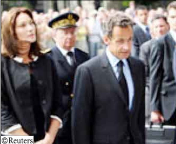
الرئيس الفرنسي نيكولا ساركوزي في طريقه لحضور قداس على ضحايا الحادث

التيارات القوية أو يغوص في مياه المحيط. وأثناء وداعه في مطار القاهرة مشى أوباما على بساط أحمر مرتديا القميص والسروال اللذين ارتداهما أثناء زيارته للمناطق الفرعونية القديمة. وعلى الرغم من أن الإدارة الأمريكية حاولت خفض سقف التوقعات في الأيام القليلة الماضية إلا أنه كانت هناك توقعات