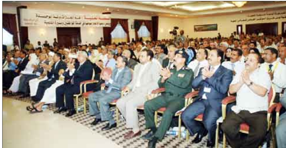
جانب من الحضور

□ عدن / سيا : أكد الاخ عبدربه منصور هادي نائب رئيس الجمهورية ان المؤتمرات الخاصة بالسلطة المحلية تمثل اطلاقاً قوياً صوب الحكم المحلي كامل الصلاحيات. وقال نائب رئيس الجمهورية في ختام أعمال المؤتمر الفرعي الموسع للسلطة المحلية بمحافظة عدن ان الثورة اليمنية كانت اللبنة الأولى للثورة الثانية التي تمثلت بإعادة الوحدة اليمنية وانتخابات المجالس المحلية مثلث الثورة الثالثة. وأشار الاخ عبدربه إلى ان الاستفتاء على دستور دولة الوحدة الذي أعقب قيام الجمهورية اليمنية واتساع النهج الديمقراطي قد مثل تاريخاً جديداً ومضيئاً في حياة اليمنيين. وأكد أن إستراتيجية الحكم المحلي تهدف في الأساس إلى إنهاء المركزية وكافة الفساد وتصحيح الاختلالات... مشدداً على أن الوحدة اليمنية بريئة كل البراءة من الفساد والفاستين والمخيلين بالنظام والقانون وأصحاب المصالح الضيقة وناهبي الأراضي. وقال الاخ عبدربه منصور هادي : نحن نعرف أن عدن هي الميناء والمطار والمصفاة وأن الذي يفكر بخصخصة المصفاة إنما هم بقول مخصصة وليس لهذا الكلام أي أساس من الصحة.. مؤكداً أن وحدة اليمن وجدت لتبقى وهي معجزة القرن العشرين في العالم العربي.