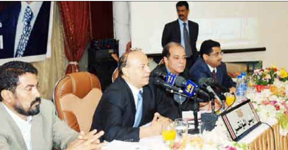
نائب رئيس الجمهورية في كلمته بختام أعمال المؤتمر الفرعي للسلطة المحلية بمحافظة عدن أمس