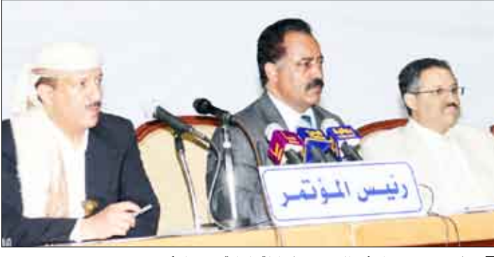
الراعي في اختتام أعمال مؤتمر السلطة المحلية بصنعاء أمس

قرارات وتوصيات ستحظى باهتمام أجهزة الدولة المعنية وستكون محط أنظار القيادة السياسية ممثلة بفخامة