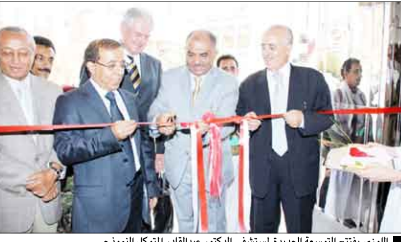
الوزي يفتتح التوسعة الجديدة لمستشفى المتوكل النموذجي

□ صنعاء / سيا : أوضح الاخ حسن الوزبي وزير الإعلام أن عدد المشاريع التنموية والخدمية التي تم افتتاحها ووضع حجر الأساس لها خلال الاحتفالات بالعيد الوطني التاسع عشر للوحدة اليمنية بلغ 4500 مشروع في مختلف المجالات. وأشار الوزبي في كلمته بحفل افتتاح التوسعة الجديدة لمستشفى الدكتور عبدالقادر المتوكل النموذجي إلى أن عدداً كبيراً من تلك المشاريع نفذت بتمويل حكومي والمشاريع الأخرى تابع لاستثمارات عربية وأجنبية. وأشاد وزير الإعلام بالتجهيزات الطبية والتقنية للمستشفى الجديد.. معتبراً أن ذلك الانجاز الطبي يشكل إضافة نوعية في جودة الخدمات الطبية التي تقدم للمواطنين وسيفضي عن السفر للخارج الذي يكلف مبالغ طائلة من العملة الصعبة. وأكد الوزبي أن الحكومة تعمل جاهدة على تشجيع الراسمال المحلي لإقامة استثمارات وخاصة في القطاع الصحي ضمن خطة الحكومة لتشجيع الراسمال المحلي على الاستثمار في المجال الصحي والصناعات الدوائية بصورة خاصة.