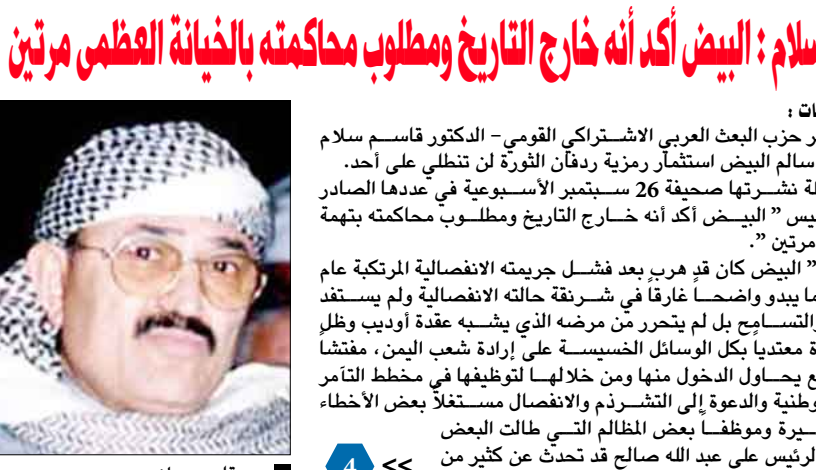
د . قاسم سلام : البيض أكد أنه خارج التاريخ ومطلوب محاكمته بالخيانة العظمى مرتين

أكد أن ما يسمى بالحراك سينتهي إلى الفراغ