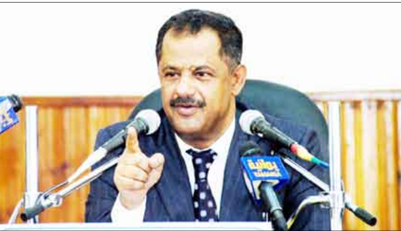
د . مجور أثناء مشاركته في فعالية اختتام أعمال المؤتمر الفرعي الموسع للسلطة المحلية بالمحويت

□ المحويت / 14 أكتوبر / سيا : أكد الدكتور / علي محمد مجور رئيس مجلس الوزراء أن انعقاد المؤتمرات الفرعية الموسعة للسلطة المحلية في المحافظات يحمل عنواناً رائعاً لسيرة العمل السياسي والديمقراطي والمشاركة الشعبية الحقيقية لاجتماعنا اليمني الجديد الواعد عطاؤه بالخير والنماء والازدهار والتقدم الاقتصادي والاجتماعي. وأشار رئيس مجلس الوزراء أثناء مشاركته أمس في فعالية اختتام أعمال المؤتمر الفرعي الموسع للسلطة المحلية بمحافظة المحويت إلى ان هذه المؤتمرات من شأنها أن تعزز مخرجات المؤتمر العام الخامس للمجالس المحلية وتجعله أكثر قابلية للتطوير. وأشار إلى ان الوطن اليمني يوحدته أصبح كبيراً وعظيماً وأصبحنا بالوحدة والديمقراطية موضع إعجاب وتقدير وانهار الجميع، وعلينا أن ندرك هذه الحقيقة ونحرص على الحفاظ على الوحدة ومنجزاتها ومكاسبها الغالية. هذا وقد صعد عدن المؤتمر الفرعي الموسع للسلطة المحلية بالمحويت بياناً ختامياً أكد تمسك أبناء محافظة المحويت بمختلف فئاتهم وانتماءاتهم الحزبية بالوحدة اليمنية.