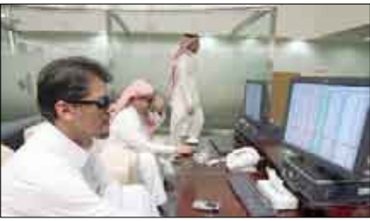
سيكون لدينا بضعة طروح أولية أخرى بحلول نهاية العام.. أنا متفائل..

وأضاف قائلا «حد أدنى مشترك من كفاية رأس المال قواعد قياسية الأشياء التي أصبحت شديدة التعقيد في أوروبا». من جانبه قال السويدي «ما يهم بالنسبة للمستثمرين أنفسهم أن يكونوا قادرين على الوصول إلى تلك الأسواق بسهولة، وأن تكون هناك قواعد تنسجم بالشفافية وقواعد مشتركة بين تلك الأسواق». ومضى قائلا «لا أعتقد أن وجود بورصة أو اثنتين أو خمس أو عشر هو المهم». وأضاف، في تصريح تلفزيوني رويترز، أن تداول شهدت 5 طروح عامة أولية هذا العام، وأعتقد أننا