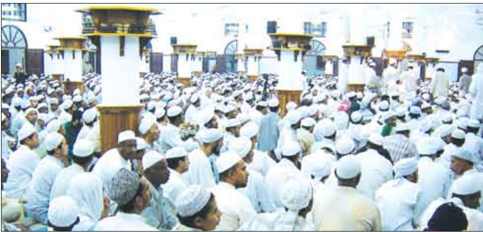
خطباء المساجد في عموم محافظات الجمهورية يدعون أبناء الشعب اليمني إلى الوقوف صفاً واحداً ضد دعاة الفتنة

دعا خطباء المساجد في عموم محافظات الجمهورية أمس في خطبتي الجمعة كافة أبناء الشعب اليمني إلى الوقوف صفاً واحداً ضد دعاة الفتنة ومثيري الشغب ومواجهة أعمال التخريب ومشاريع الفرقة والانقسام التي تسوقها عناصر خارجة على النظام والقانون. وحذر الخطباء من التمادي في استهداف وحدة الوطن وأمنه واستقراره وإطلاق السكينة العامة للمجتمع، مؤكداً أن الوحدة اليمنية تشكل لبنة أساسية في صرح الوحدة العربية والإسلامية، وأن تحقيقها والحفاظ عليها والدفاع عنها إنما يأتي في سياق أمر الله في وحدة المسلمين التي