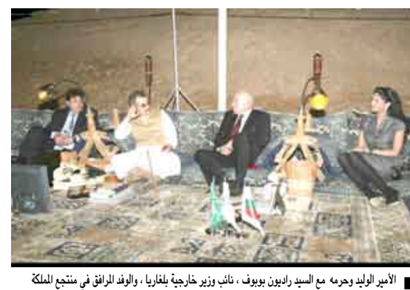
الأمير الوليد يجتمع مع السيد راينون بوبوف، نائب وزير خارجية بلغاريا، والوفد الرفيق في منتج الملكة

استثمارات الأمير الوليد وبحث الفرص الاستثمارية هناك وخاصة في مجال الفتحة، كما أكد حرص الحكومة على تدليل جميع العقبان التي قد تواجه استثماراتها سموه في البلاد. وخلال زيارة نائب وزير الخارجية تم اصطحابه في جولة حول مشاريع شركة المملكة القابضة بالإضافة إلى زيارة شركة روتانا. تضمنت الجولة زيارة مدارس المملكة، مدينة الملكة، مستشفى سعودي ومركز الملكة. وتشمل استثمارات الأمير الوليد في بلغاريا القطاع المصرفي من خلال سيتي غروب Citigroup.