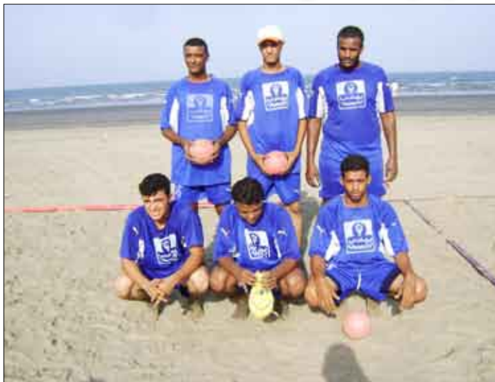
فريق شباب الجيل