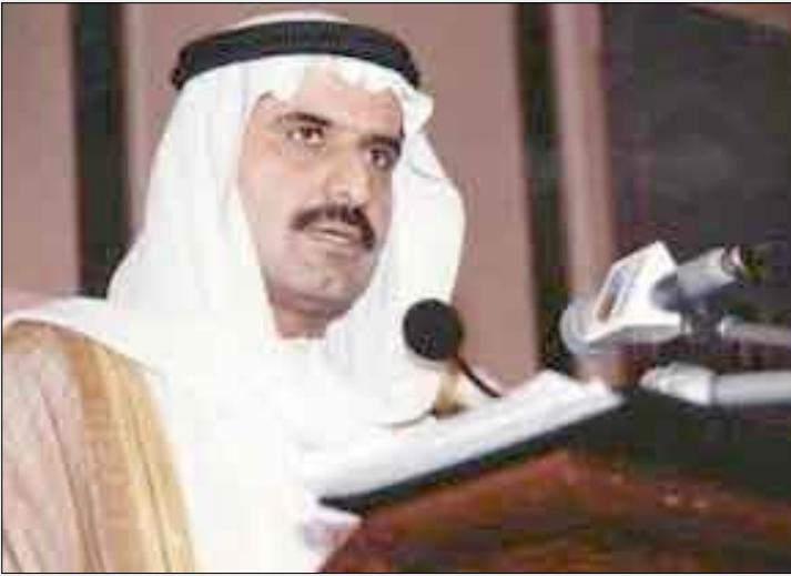
فلاسي أقبل من منصبه الوزاري تمهيداً لمحاكمته

بعد وفاة شريكه فيها، وهو لبناني، علماً أن شقيقه الشريك المتوفى تقدمت بالدعوى. وكان الفلاسي أقبل في يوليو 2008م من منصبه وزير دولة في الحكومة الإماراتية التي أعلنت في 17 فبراير 2008م، بعدما كان وزيراً وكيلاً لوزارة التربية والتعليم، كما كان أول سفير تعينه الإمارات لدى استراليا. وقد شغل عدة مناصب عليا، منها عضوية المجلس الأعلى للشباب والرياضة، ومجلس الخدمة المدنية، ومجلس إدارة معهد الإمارات للتدريب المصرفي، وكان عضواً في الهيئة الاستشارية للمجلس الأعلى لدول مجلس التعاون. كما شغل، أيضاً، مناصب غير رسمية عدة، منها: رئيس مجلس أمناء مؤسسة سلطان العويس الثقافية، وعضو في جمعية الإمارات لحقوق الإنسان، وجمعية الإجماع، وجمعية أصدقاء البيئة، ومجلس أمناء مركز الدراسات العربية والإسلامية في استراليا. ويرأس عدداً من الشركات العاملة في