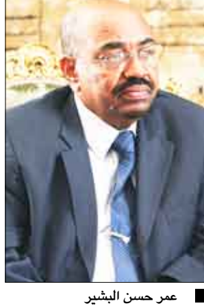
عمر حسن البشير

وصف الرئيس عمر حسن البشير رئيس جمهورية السودان الشقيق الوحدة اليمنية بالإنتاج التاريخي الذي يجب على اليمنيين الحفاظ عليه وأن يعوضوا عليه بالنواجذ. وأوضح الرئيس السوداني في حوار نشرته صحيفة 26 سبتمبر أن الفرقة والشقاق لن يستفيد منها إلا أعداء اليمن والذين يتعقون بالشؤم والخراب. وقال البشير إن أصوات الدعوة إلى الانفصال لن تجد أذاناً صاغية إلا عند من يريدون أن يعيدوا باليمن القهقري حتى تبقى ثرواته وخبراته مخزونا لدول الاستكبار. وأضاف أن ما يعاني منه اليمن من دعوات انفصال تعاني منها في السودان.. والودع واحد.. والإعلام الذي يروج لمثل هذه الترهات واحد.. والنتيجة واحدة إذا وقع انفصال لا سمح الله.