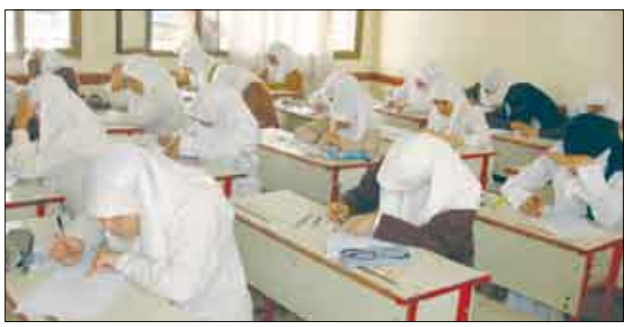
من مراكز الامتحانات / إريشيف