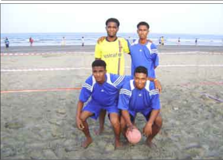
فريق شباب الجيل