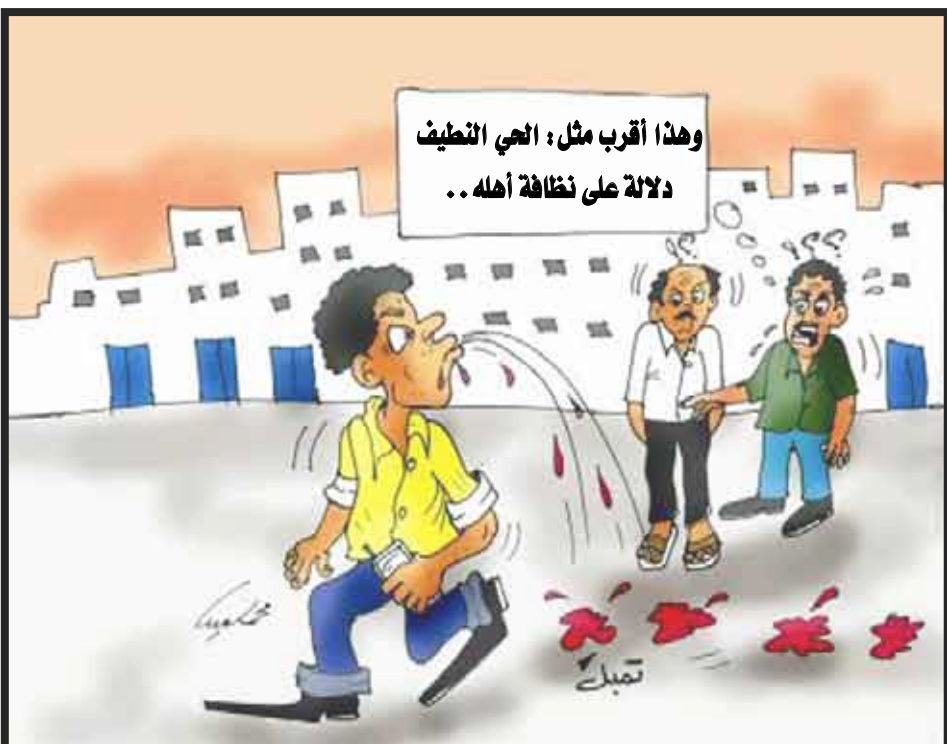
وهذا أقرب مثل: الحي النظيف دلالة على نظافة أهله ..