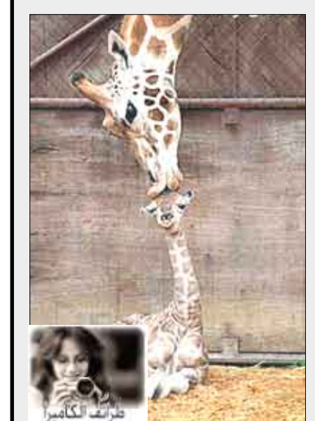
يا لها من أم حنون!

روما/سبأ : احتضنت منطقة بيزا بالعاصمة الإيطالية روما أمس معرض الآثار اليمنية القديمة التي يعود تاريخها إلى فترة قيام الدولة الحميرية في القرنين الأول والثاني الميلاديين وذلك في إطار احتفالات اليمن بالعيد الوطني الـ 19 للجمهورية اليمنية. وحشد المعرض لدى افتتاحه عمق العلاقات اليمنية الإيطالية التاريخية التي يتميز بها البلدين الصديقين وخاصة في مجال الثقافة والفنون والآثار. ويمتاز المعرض بعرض نثرة من تفاصيل حضارة الدولة الحميرية القديمة من خلال العديد من القطع الأثرية البرونزية اليمنية القديمة، على ساحة عرض ليمونيا بالقرب من البرج المائل الشهير، ليسجدا بذلك التأكيد على مدى الصلات والعلاقات التاريخية التي تربط البلدين الصديقين.