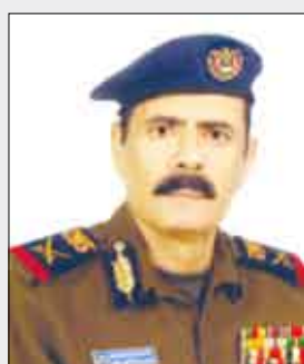
صالح حسين الزوعري

تشرها بعض وسائل الإعلام من خلال اعطائها ابعاداً غير موضوعية عند تطهيتها للأعمال المناهضة للقانون، فهناك ظاهرة قطع الطرقات (الحرابة) التي يجرمها القانون ويجرمها ديننا الإسلامي الحنيف التي تخالفين بعض المناطق وهي الطريقة الأنسب لهؤلاء المخالفين من وجهة نظرهم لتوصيل مطالبهم للسلطات المحلية، وما حصل في الطريق العام بمدينة ردفان من قطع يأتي في سياق تلك المطالبات.. فلا ينبغي على بعض الوسائل الإعلامية أن تعتمد على معلومات بعض العناصر المنسدة لتسييس هذه المطالب التي تستغل قبل القاطنين على الوحدة. واختتم اللواء ركن صالح الزوعري نائب وزير الداخلية تصريحه بدعوته العناصر المأزومة في الكف عن دعواتها للمشاريع المكسرة واستجابتها للاجتماع الوطني المنعقد في مناقشة كافة القضايا والهجوم الوطنية بروح المسؤولية الوطنية تحت سقف الوحدة المباركة التي ترسخت جذورها في ربوع الوطن على مدى 19 عاماً.