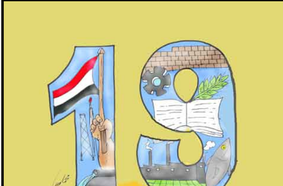
عاما من إنجازات الوحدة اليمنية

قامت قيادة محافظة عدن بافتتاح الحدائق في مديريات التواهي والملا صباح يوم أمس بعد ان تمت اعادة تاهيلها وعلى هذا الاساس توجه كثير من الاطفال والاسر مساءً لدخول هذه الحدائق التي ظلت مغلقة في وجه الجميع رغم الافتتاح الرسمي الذي استقبله الجميع بارتياح كبير والدليل بتجمع الاطفال امام البوابات المغلقة ويفرحة ما تمت .