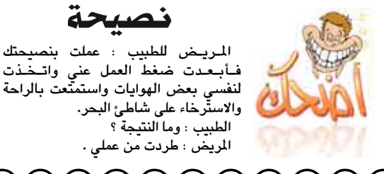
نصيحة المرضى الطبيب : عملت بنصيحتك فابعدت ضغط العمل عني واتخذت لنفسى بعض الهويات واستمتعت بالراحة والاسترخاء على شاطئ البحر. الطبيب : وما النتيجة ؟ المرضى : طردت من عملي .