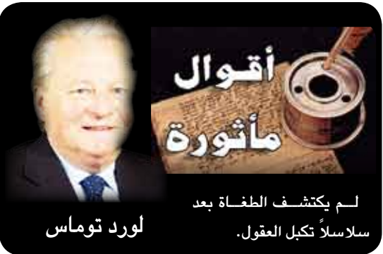
لم يكتشف الخطة بعد لورد توماس سلاسل تكبل العقول.

وسيجمل الباحثون في بحثهم تجهيزات تسمح لهم بالرؤية خلال الليل بالإضافة إلى تجهيزات تصوير وتسجيل صوتي. يشار إلى ان الحكايات تقول ان «بيج فوت» يحب رمي الحجارة في أماكن المخيمات ولكن ليس للأذية وإنما لرؤية رد الفعل فحسب وفقاً لجريدة «الغيس».