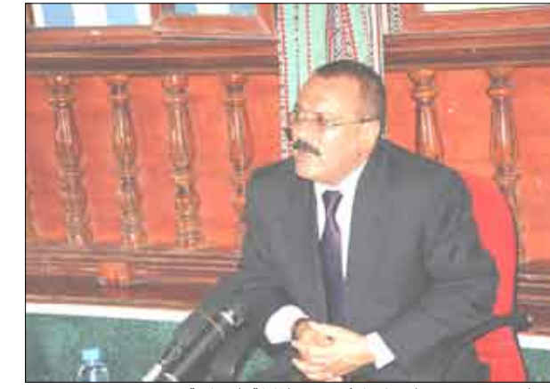
من المشاركين في القافلة