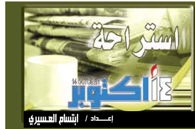
إعداد / إنسان العسيري

بريدا الكترونيا في لغة تختلف عن لغته الام، فان «جي مايل» سيساعده على ترجمته الى لغة يفهمها. واضافت «في حال استخدم جميع المتحاورين +جي مايل» يمكن عندئذ اقامة حوارات كاملة في لغات عدة، على ان يكون في وسع كل مشارك ان يقرأ الرسائل في اللغة التي يفضلها. ويتم العمل في الاساس بخدمة «غوغل ترانسلايت» لتوفير ترجمات تلقائية لصفحات او مدونات الكترونية. واشنطن / متاعات : اعلنت «غوغل» اضافة خدمة الترجمة التلقائية إلى وظيفة الرسائل البريدية «جي مايل»، لتسمح بذلك لمستخدميها بترجمة رسائلهم الى لغات اخرى من خلال نقر بسيط على الفأرة. وادخل عملاق الانترنت الى «جي مايل» برنامج «غوغل ترانسلايت» الذي يسمح بترجمة الرسائل الى عشرات اللغات. وشرحت الادارة في رسالة على مدونة «غوغل» الالكترونية أنه عندما يتلقى المرء