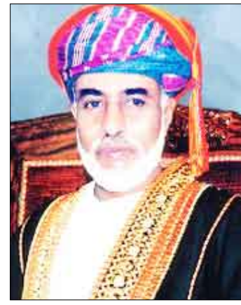
قايوس بن سعيد