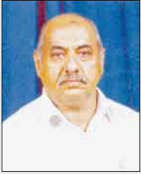
شعر/ د. علوي عبدالله طاهر