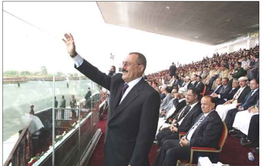
لقطتان من العرض العسكري