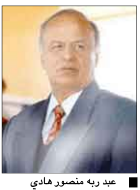
عبد ربه منصور هادي

الموحدة وتعايشها المجتمعات المحلية حركة وعطاء ونماء. وأضاف الأخ نائب الرئيس ان الشواهد البارزة من الصور المشرفة لحقيقة الإنجاز والعطاء الحضوري تعكسها مواكبة الأنشطة الإنشائية إلى كل منطقة ومديرية ومحافظة والتي تقوم على رؤية شاملة ومتساوية إلى كل المكونات الاجتماعية، مشيراً إلى ان عظمة اليمن ان تكون جغرافيتها بهوية وحدوية وأن تكون القيادة السياسية ضالعة في صميم الانتماء الحضوري لليمن.