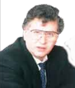
للشاعر / سميح القاسم