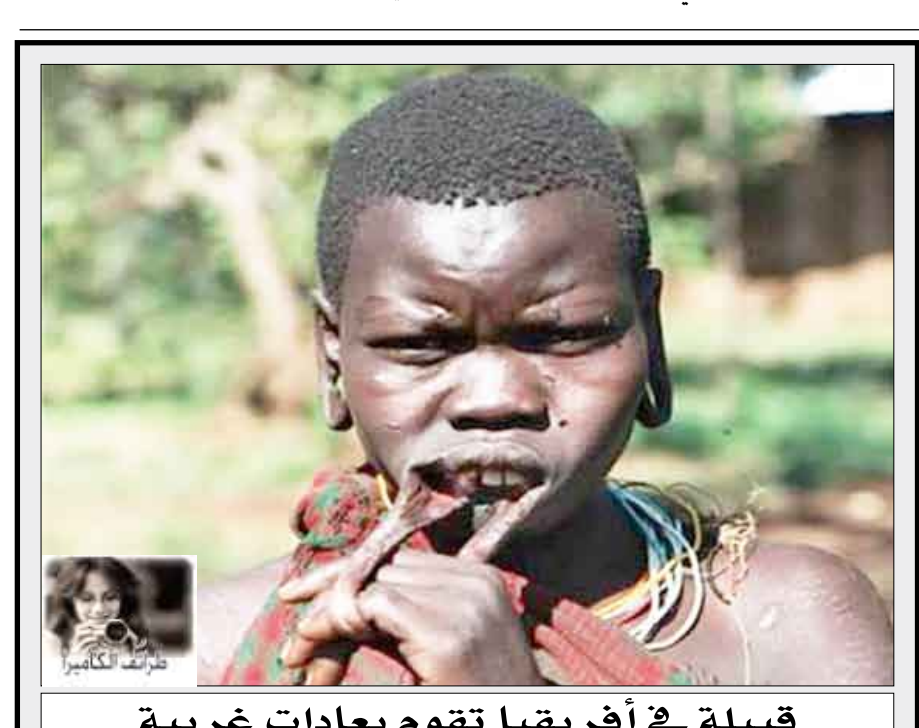
قبيلة في أفريقيا تقوم بعبادات غريبة