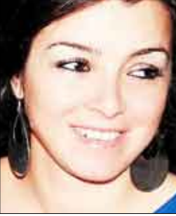
الشاعرة اللبنانية / سوزان تلحوق