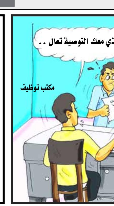
أنت الذي معك التوصية تعال ..