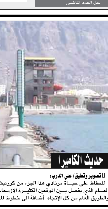
تصوير وتعليق/ علي الدرب: