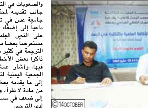
صنعاؤه/ محمد جابر صلاح...

قامت بالإشراف على ترجمة بعض الكتب العلمية إلى العربية، وأشار عمشوش إلى أن مسألة وقوع العرب تحت طائلة التلغين للعالم أكثر من كونهم منتمين له، ورغم بروز عدد لا يستهان به من العقول المبدعة والبنكر، ومنها إلى بروز الترجمة العلمية كوسيلة يمكن من خلالها متابعة مستجدات العلوم والتكنولوجيا، إذا ما أردنا السير في ركب التقدم على حد قوله.