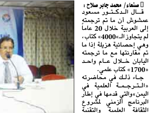
صنعاؤه/ محمد جابر صلاح...

قامت بالإشراف على ترجمة بعض الكتب العلمية إلى العربية، وأشار عمشوش إلى أن مسألة وقوع العرب تحت طائلة التلغين للعالم أكثر من كونهم منتمين له، ورغم بروز عدد لا يستهان به من العقول المبدعة والبنكر، ومنها إلى بروز الترجمة العلمية كوسيلة يمكن من خلالها متابعة مستجدات العلوم والتكنولوجيا، إذا ما أردنا السير في ركب التقدم على حد قوله.