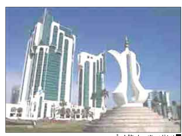
انخفاض الاسعار القطرية

أوضح بنك «إتش إس بي سي» أن الانخفاض الحاد في أسعار الثلاثة الأولى من 2009م يشير إلى تباطؤ في الطلب المحلي، وقد يشير إلى أن الدولة لا تزال تعاني من أوبك تم بالفعل بانكماش على أساس سنوي. وفي وقت سابق من الشهر الجاري قال جهاز الإحصاء في قطر: إن مؤشرًا جديدًا لأسعار المستهلك أظهر أن الأسعار تراجعت أكثر من 9% في الربع الأول، مقارنة مع الربع الأخير، مع انخفاض تكاليف الإسكان 16% وهبوط أسعار المواد الغذائية. ولم ينشر الجهاز أرقامًا للمقارنة مع الربع الأول من 2008م. وقال سايمون وليامز الخبير لدى «إتش إس بي سي» في مذكرة بحثية: «بعد 14 ربعاً متتالياً من بقائه عند مستويات تزيد على 10%، تشير البيانات التي نشرت مؤخرًا إلى أن التضخم في قطر لم يتراجع فحسب في الربع الأول، وإنما تحول فعلياً إلى انكماش.» وأضاف في المذكرة هذا الأسبوع ورغم أننا نتعامل بحذر مع البيانات، إلا أن شدة ونطاق الانخفاض في الأسعار الذي تحدثت عنه في الربع الأول من العام مؤشر على تغيير مفاجئ في توجهات الطلب المحلي. وأشار «إتش إس بي سي» إلى أن إعادة قراءة البيانات تشير إلى أن أسعار المستهلك على أساس سنوي تراجعت بـ 2.4% في الربع الأول من