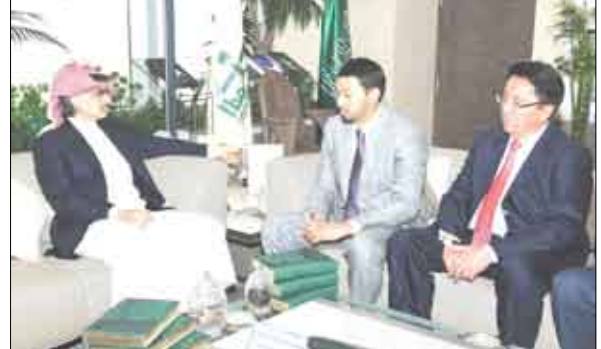
الأمير الوليد مع مبعوث رئيس وزراء كازاخستان

من رئيس وزراء بلاده كما وجه دعوة من الرئيس الكازاخستاني لسموه زيارة البلاد للإطلاع على الفرص الاستثمارية المتاحة في قطاعات الخدمات المالية والبتروكيمياويات والمعمار. وأطلع الأمير الوليد سعادة المبعوث على تطورات العمل في فندق فيرمونت في كازاخستان كما تناول الطرفان عدداً من المواضيع بالإضافة إلى الوضع الاقتصادي العالمي. وقد أشار المبعوث إلى أن زيارة سمو الأمير للبلاد تقوي العلاقات بين البلدين كما أعرب عن حرص بلاده على جذب الاستثمارات الأمير الوليد، وفي نهاية اللقاء، وعد سمو الأمير الوليد بزيارة البلاد في المستقبل القريب وبدراسة الفرص الاستثمارية المتاحة.