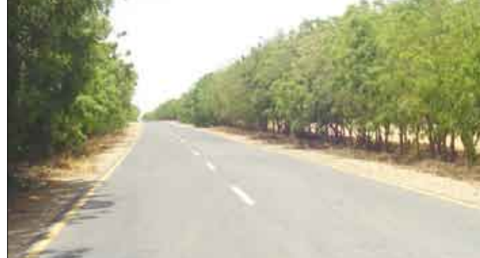
الطرق والجسور خلال التسعة عشر عاماً الماضية بلغ /178/ ألفاً و /957/ متراً. وأوضح التقرير أن هذه الأطوال توزعت على /21/ مشروعاً تم تمويلها مركزياً منها /10/ مشاريع مستحقة في مشروع طريق جولة كالنكس - الريفقة بطول /18/ ألفاً و /700/ متر، ومشروع طرقات وساحات إستناد 22 مايو بطول /6/ آلاف متر.

مشروع الطرق الأولية الترابية بطول /30/ ألف متر. بالإضافة إلى مشروع طريق بدر البحري بطول /77/ آلاف و /500/ متر، ومشروع طريق كابوتا - دار سعد - آيين بطول /22/ ألف متر، وطريق دار سعد - الرباط بطول /77/ آلاف متر. وكذا مشروع مدخل ميناء المعلا بطول /560/ متراً، ومشروع طريق فقم - عمران بطول /17/ ألف متر، ومشروع طريق صيرة بطول /800/ متر، ومشروع طريق رأس عمران - مشهور (جزئي) بطول /28/ ألف متر. وبين التقرير أن مشاريع إعادة التاهيل والسفلة شملت /11/ مشروعاً في مشروع طريق جولة العريش - العلم بطول /5/ آلاف و /200/ متر، وطريق صلاح الدين - فقم بطول الفين و /500/ متر، وطرقات المنصورة الداخلية بطول /2000/ متر، وطريق مدينة الشعب - بئر احمد بطول /11/ ألف و /300/ متر. إلى جانب صيانة وإعادة تاهيل طريق