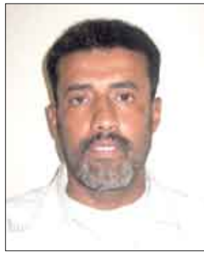
رئيس نادي شباب القطن