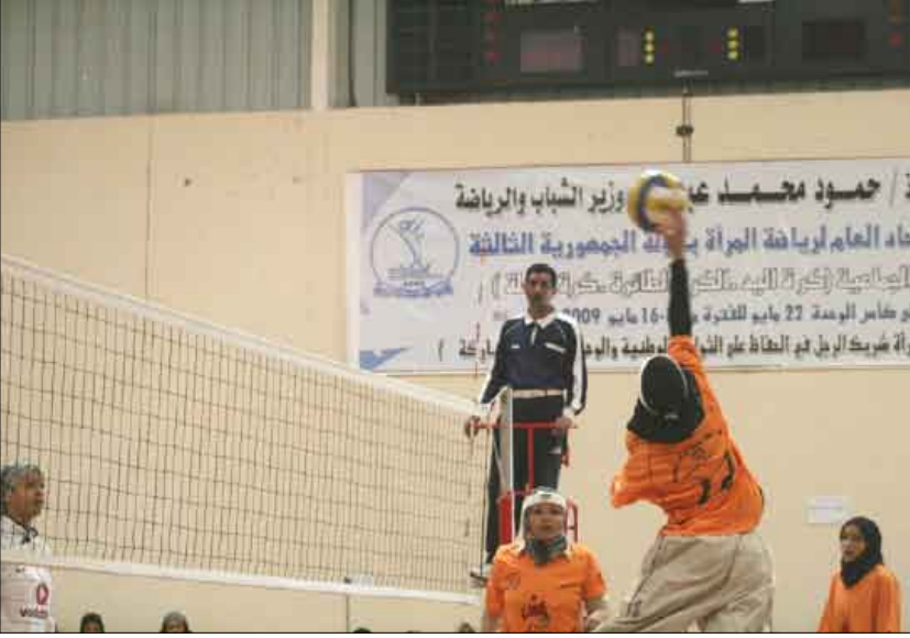
لقطة من المباراة

قالت : شرف كبير لنا أن نتكرم في ظل الوحدة اليمنية التي تحققت في الثاني والعشرين من مايو الجيد وهي المرة الأولى التي نتكرم فيها كلاعبات قديمت ومدرجات حالاتنا نحن عاصرتنا للرياضة منذ العام 1976 م ضمن صفوف المنتخب الوطني للطائرة ومثلنا اليمن في كثير من المحافل العربية والدولية واليوم نتكرم في ظل وجود اتحاد المرأة وقيادة وزارة الشباب والرياضة التي تدعم الرياضة النسوية بشكل كبير.. أتمنى أن يستمر مثل هذا التكريم للأجيال التي تأتي بعدنا وكنا لانتلحق حتى كلمة شكر من أي اتحاد أو أية قيادة رغم أننا لازلنا رياضيات حتى اليوم..الوحدة هي عزتنا وكرامتنا وقد مثلت الوطن في العديد من المهرجانات كوني قائدة عروض.. أدعو جميع المواطنين أن يتحدوا لأن الوحدة هي الأمل وبوجود الوحدة وفخامة الرئيس علي عبد الله صالح سنظل بلادنا في خير ويكفينا شتات وتشجيع دام عدة أعوام والجميل هو هذا الالتقاء الكبير بين قنيتا الوطن الواحد في تجمع رياضي كبير.