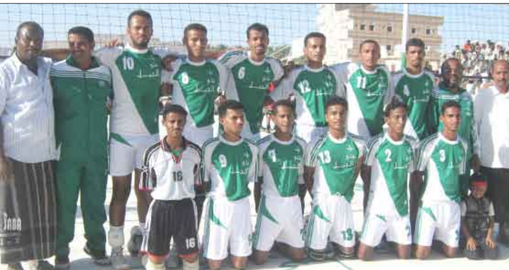
فريق شباب القطن