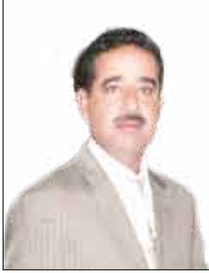
الشاعر السوري / فاروق طوزو

أي جرح هذا المساء في ريشتك يا قلم هل جرحتك السياسة أم قصاصة ورق من الحبيبة داهمتك وخرت فيك الألم أخشي عليك هذه الليلة النزيف وأخاف على نفسي أن يستيقظ فيها جرح الوجع