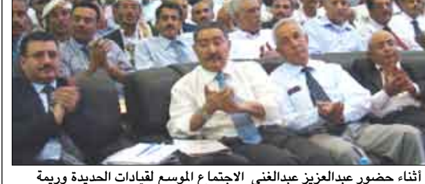
لقاء جمع قيادتي مؤسستي المياه والصرف الصحي بمحافظة عدن واين أس

أخذ اللقاء الذي جمع أمس قيادتي مؤسستي المياه والصرف الصحي بمحافظة عدن واين برئاسة وزير المياه والبيئة المهندس عبد الرحمن الارياني عدداً من المعالجات لحل مشكلة انقطاع المياه عن المحافظتين، وتأثيره على حياة المواطنين في الوقت الذي تزداد فيه حرارة الصيف. وكان أبرز هذه المعالجات التنسيق المشترك بين مؤسستي المياه في عدن واين لوضع الآلية المناسبة لتوزيع المياه والاستفادة من إمكانيات وقدرات مؤسسة عدن في تحسين مستوى نشاط مؤسسة المياه باين. وفي الاجتماع الذي ضم وزير الصحة