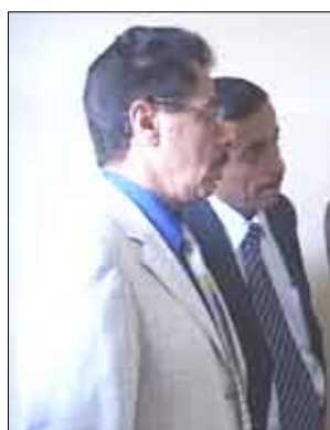
السملاوي والأغبري يتفقدان سير امتحانات طلاب المعهد العالي للقضاء

أكد الدكتور الأغبري إنه سيتم إنشاء محكمة مقرها العاصمة صنعاء للنظر في قضايا الصحافة والمطبوعات والنشر المنصوص عليها في القوانين ذات الصلة باعتبارها قضايا نوعية تستدعي سرعة الفصل فيها، بدلاً من تشتت قضايا النشر في أكثر من محكمة، ولطبيعة قضايا النشر التي تحتاج إلى مهنية عالية في فهم دور الصحافة، وتقديرها لرسالة الصحافة والصرفيين. جاء ذلك أثناء تفقد رئيس مجلس القضاء الأعلى رئيس المحكمة العليا القاضي عصام عبد الوهاب السملاوي ومعه وزير العدل الدكتور غازي شائف الأغبري سير امتحانات طلاب المعهد العالي للقضاء للعام الدراسي 2008م. واستمع القاضي السملاوي والدكتور الأغبري من عميد المعهد العالي للقضاء الدكتور يحيى الجرافي إلى شرح عن سير الامتحانات التحريرية والشفوية لطلاب الدراسات التخصصية العليا للدفع (15) و (16) و (17) وعددهم