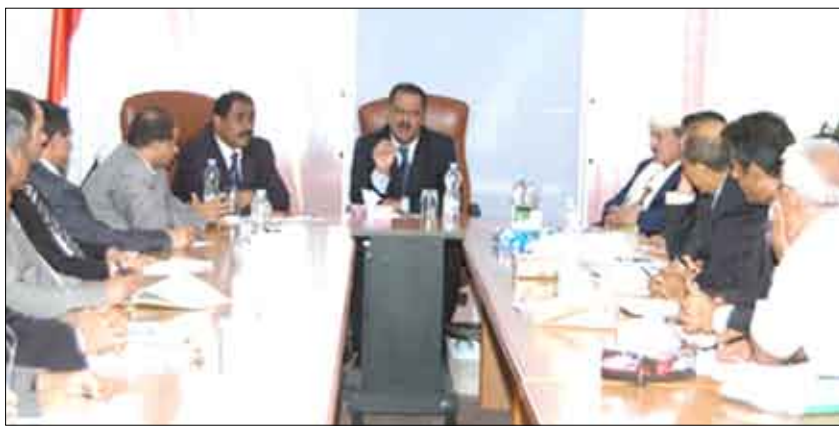
د. مجور خلال لقائه قيادة وزارة الكهرباء

وجه الدكتور علي محمد مجور، رئيس مجلس الوزراء ووزارة الكهرباء والطاقة بإعطاء الأولوية في نشاطها خلال الفترة الراهنة لعملية التوليد مستقر ومواكب بصورة مستمرة للاحتياجات الحالية والمستمرة. جاء ذلك خلال الزيارة التي قام بها رئيس الوزراء أمس لوزارة الكهرباء والطاقة ولقائه بالمسؤولين في الوزارة والمؤسسات التابعة لها حيث جرى مناقشة سير المشاريع القائمة والقادمة بمجال الطاقة والهدافة إلى تحسين وضع الكهرباء في الشبكة الوطنية والقضاء على الفجوة القائمة ما بين الطاقة المتوفرة حالياً وحجم الطلب المتنامي على مستوى الجمهورية