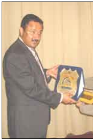
الصوفي يكرم 70 مدرساً ومدرسة من جمعية الأمل للمعاقين

تعزيز / نعمان خالد: وجه الأخ / حمود خالد الصوفي محافظ محافظة تعز الخدمة المدنية باستيعاب فئة المعاقين في عملية التوظيف خاصة بالمحافظة خاصة وأن هناك مدرسين يعملون طواعية منذ سنين ولم يتم توظيفهم. جاء ذلك في حفل تكريم 70 مدرساً ومدرسة من جمعية الأمل للمعاقين