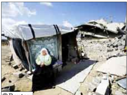
امرأة فلسطينية مشردة تجلس خارج خيمتها التي بنتها في غزة

وإصابة مدنيين واستندت إلى هذا كدليل على ارتكاب جرائم حرب. وتقول جماعات حقوقية فلسطينية أن 1417 فلسطينيا بينهم 926 مدنيًا قتلوا في الهجوم الإسرائيلي على غزة. وتنتفي إسرائيل هذه الأرقام.