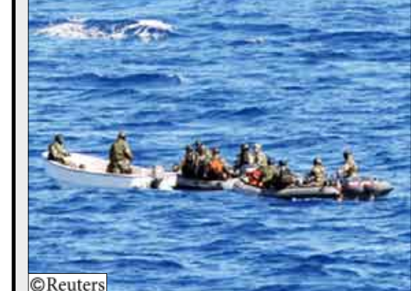
القوات الدولية تلقي القبض على قارب للقرصنة الصوماليين في البحر الأحمر

مقدشو 14 أكتوبر/رويترز، أفاد مسؤولون من 12 شخصًا على الأقل قتلوا وأصيب عشرات في اشتباكات بين متمردين وميليشيات مؤيدة لحكومة الصومال في أحدث قتال في الصومال. وتكاثف وجود حكومة الرئيس شيخ شريف أحمد للتصدي لتمرد قوي يقوده متمردون وتحاول اجتناب متمردين آخرين إلى إدارته التي يعتبرها كثيرون أفضل فرصة للسلام بعد 18 عامًا من الحرب. وذكر سكان أن مقاتلي جماعة الشباب وأعضاء جماعة إسلامية موالية للحكومة تبادلوا إطلاق قذائف المورتر والنيران المضادة للطائرات في وقت متأخر الليلة قبل الماضية على طريق في العاصمة الصومالية مقديشو. وأصبح شيخ عبد الرحيم عيسى أبو المتحدث باسم اتحاد المحاكم الإسلامية المؤيد للحكومة عبر الهاتف «المعارضة هاجمت مقاتلين وجنود الحكومة وقتلوا إلى جانبها». وأضاف «قتلنا ثمانية منهم وأصيبنا 30 آخرين وأنا على يقين من موت آخرين. كما استولينا منهم على صاروخ مضاد للطائرات كان متهبًا على عربة قتالية. قتل من جانبنا أربعة وأصيب ستة آخرون كما أصيب مدنيون آخرون»، ولم يتسن الوصول إلى مسؤولي الشباب للحصول على تعليق.