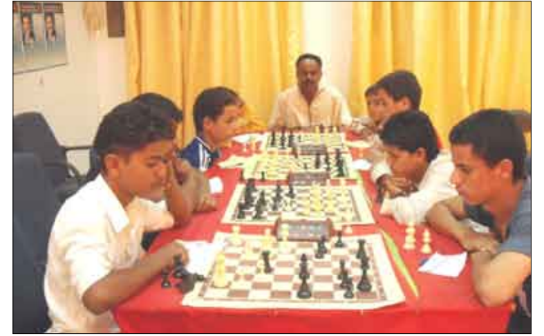
تواصل بطولة المراكز للشطرنج