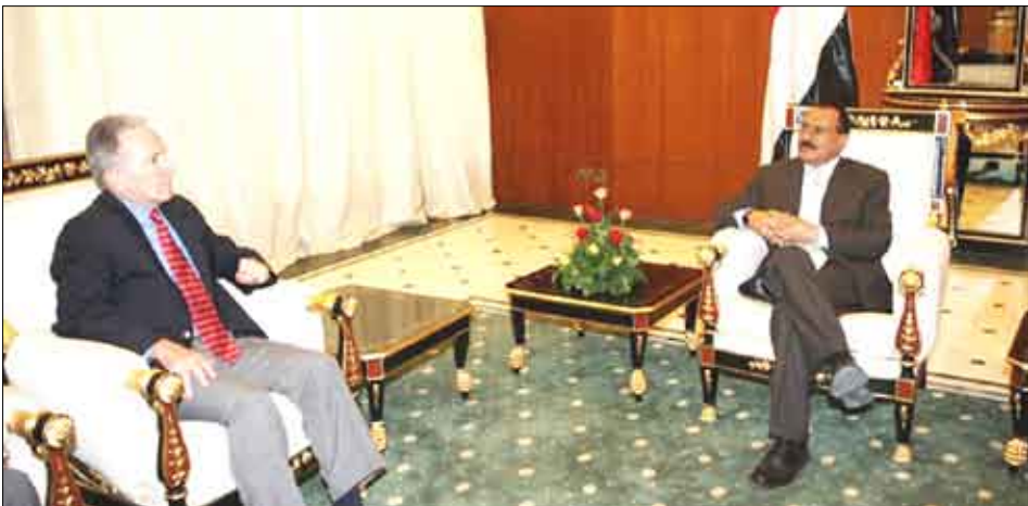
رئيس الجمهورية أثناء استقباله السفير الأمريكي بصنعاء ستييفن سيش أمس

صنعاء/سيا: استقبل فخامة الأخ الرئيس علي عبدالله صالح رئيس الجمهورية أمس السفير الأمريكي بصنعاء ستييفن سيش . وجرى بحث عدد من القضايا التي تهم العلاقات الثنائية ومجالات التعاون المشترك بين البلدين الصديقين . وقد جدد السفير الأمريكي خلال اللقاء موقف الولايات المتحدة الأمريكية الداعم لليمن ووحدة وأمنه واستقراره . وقال « الولايات المتحدة الأمريكية دوماً مع اليمن موحد مستقر وديمقراطي ، وأن وحدة اليمن عنصر مهم للأمن والاستقرار في المنطقة ».