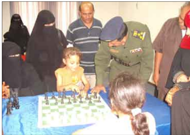
مدير امن عدن يتفقد سير المباريات