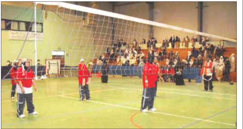
لقطة من المباريات