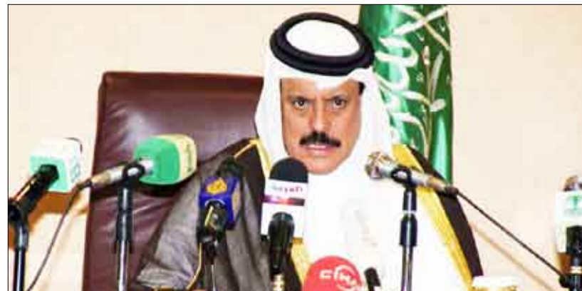
عبد الرحمن العطية في مؤتمر صحفي عقده أمس في الرياض

الرياض/سيا: أكد قادة دول مجلس التعاون لدول الخليج العربية موقف دولهم الداعم لاستقرار اليمن ووحدة وازدهاره . وقال الأمين العام لمجلس التعاون الخليجي عبدالرحمن العطية في مؤتمر صحفي عقده مساء أمس في الرياض في ختام أعمال القمة الخليجية التشاورية الثالثة عشرة : « نحن مع يمن موحد ومستقر ومزدهر ومع كل ما من شأنه تعزيز أمن اليمن واستقراره والحفاظ على وحدته » . وأضاف : « لقد تعهدت دول مجلس التعاون بدعم جهود التنمية في الجمهورية اليمنية من خلال مؤتمر المانحين الذي عقد في لندن عام 2006 ووجدت تعهداتها في اللقاء التشاوري للمانحين الأخير المتفق بصنعاء » . وقال : « كنا ومازلنا مع أشقائنا في اليمن ونحن حريصون كل الحرص على وحدة اليمن وسياسته واستقراره » .