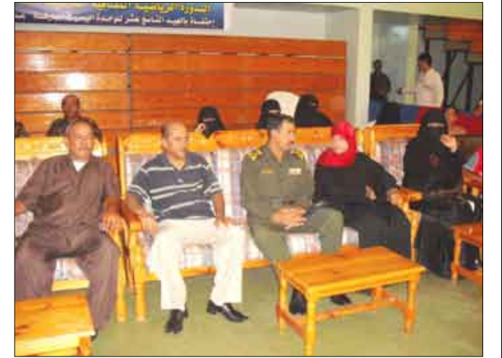
لقطة من الحضور