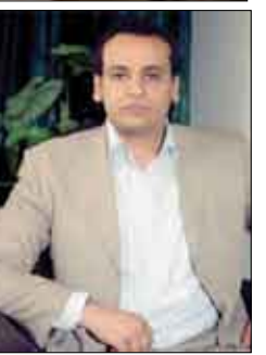
الشاعر الأردني / محمد الدحيات

أنا للرة بيمص في آخره سواي... ولا أراه، أنا الزهد تشدت خاصرتي وتكشم البذاير بها فأحسب أن سكتها بداخلها أو أن شجرة نبئت... أصبح، أنذر، أحبس صبيحتي عن صوتها... ما كنت أعلم قبل عن أن الأوتة شككت من ضلع خاصرتي وأن جميع نواتي لها أزل يهيجها وأن لها أيدياً