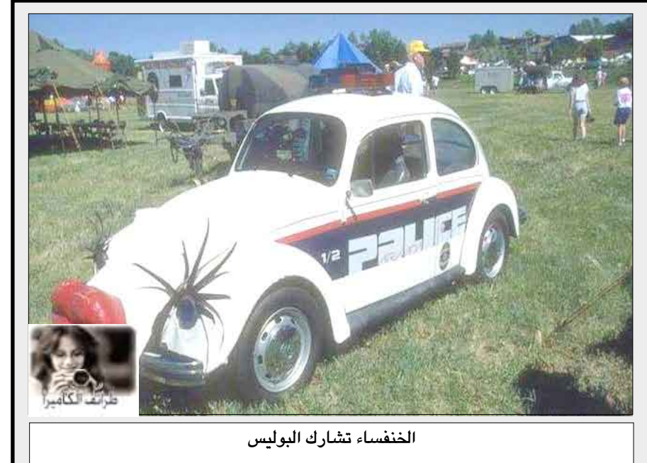
الخنفساء تشارك البوليس

لم يجد زوج إلا موقع «اليوتيوب» لانقاذ زوجته ومساعدتها في عملية الولادة بعد ما تأخرت سيارة الاسعاف عن الوصول. وكان مهندس بريطاني قد شاهد أفلام فيديو خاصة لعملية الولادة على موقع «يوتيوب»، وتمكن من توليد زوجته بنفسه بعدما داهمتها آلام المخاض أربع ساعات وفي النهاية نجح في عملية التوليد.