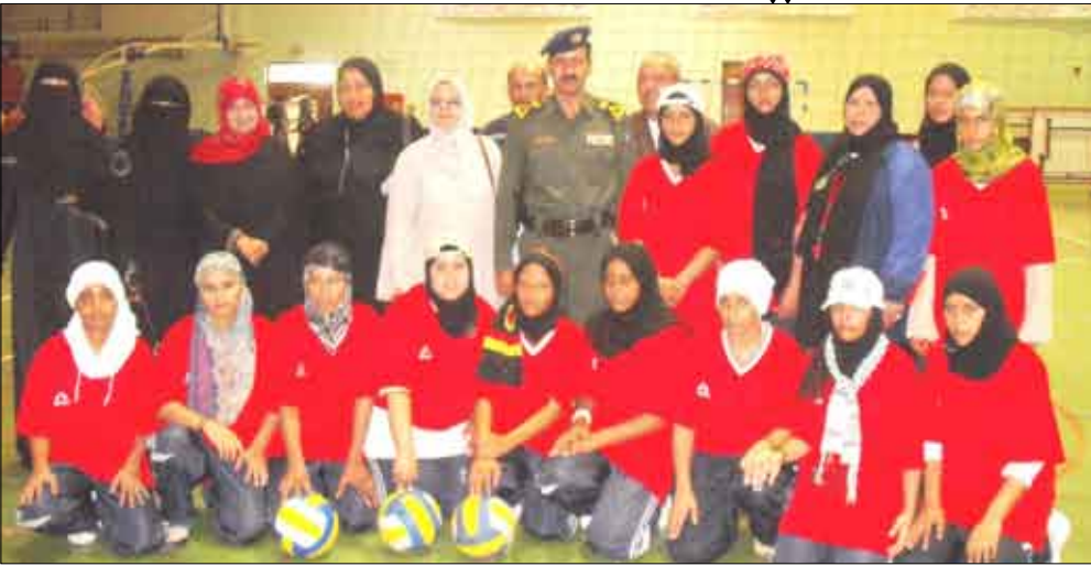
قيران مع منتخب عدن للفتيات