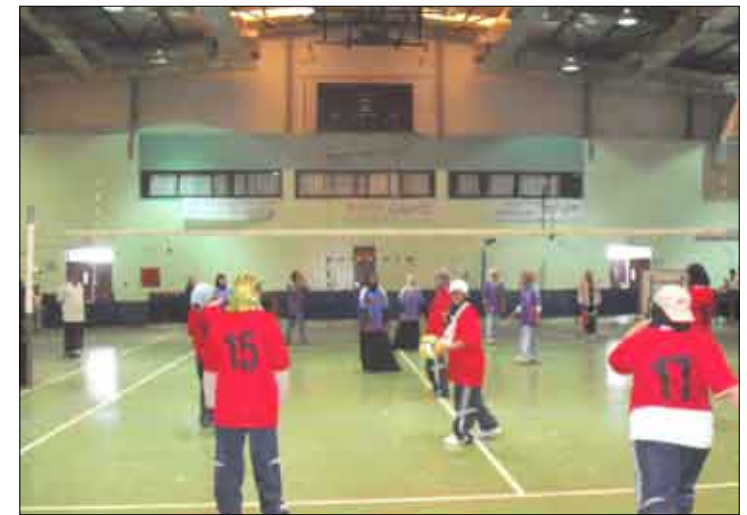
لقطة من إحدى المباريات