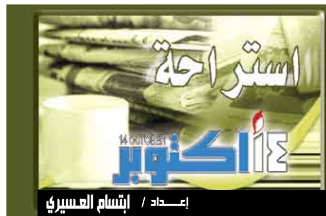
إعداد / إتيان العسيري

وأضاف «التكلفة متساوية بالنسبة لنا، لكن منظر الماعز أطف من ماكينات جز الحشائش». وليست غوغل الشركة الوحيدة التي تلجأ إلى الماعز لقص حشائشها، فقد سبقتها إلى ذلك إدارة موقع «ياهو» الشهير مرة أو اثنتين التي تستعين بالماعز مرة أو اثنتين سنوياً فضلاً عن بلدية مدينة سان فرانسيسكو. وكان محرك البحث «غوغل» قد أوقف في الآونة الأخيرة إيقاع تعاقداته السريع مع موظفين جدد بسبب الأزمة الاقتصادية.