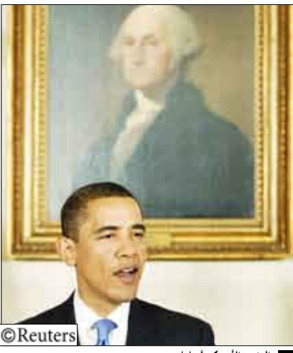
الرئيس الأمريكي أوباما