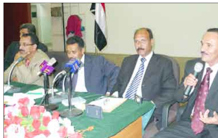
من ندوة ( الثوابت الوطنية وترسيخ الوحدة الاجتماعية ) بصنعاء أمس