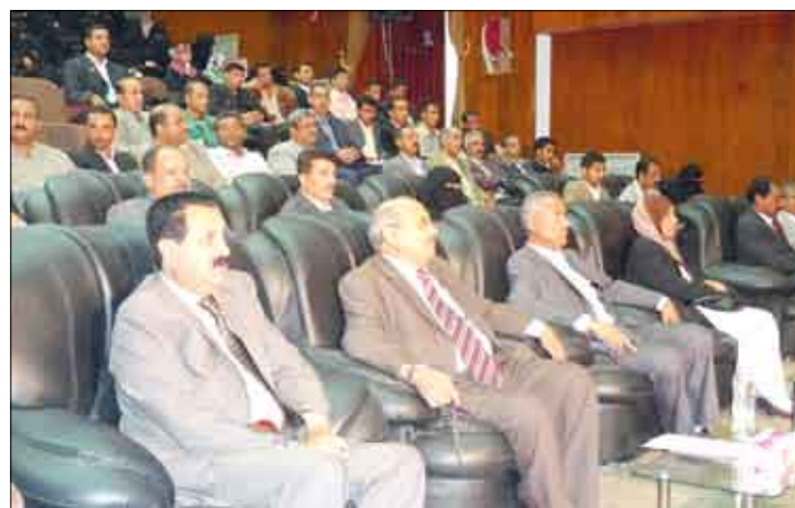
من ندوة ( الثوابت الوطنية وترسيخ الوحدة الاجتماعية ) بصنعاء أمس