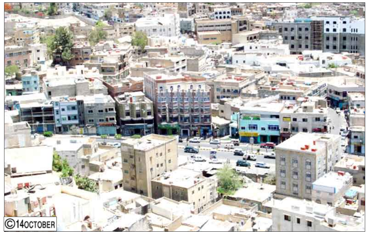
صورة عامة لتعز