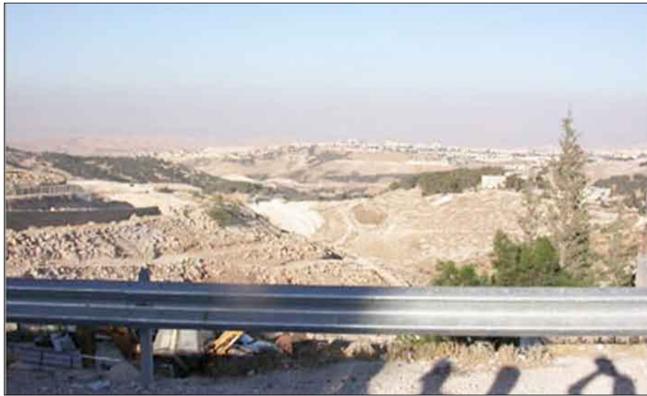
توسيع استيطان إسرائيلي بين القدس والضفة

إضافة أي بناء على المباني القائمة. ووصف التقرير أوامر الهدم الأخيرة لمبنيين في كنيسة الأرمن الكاثوليك والدير التابع لها بأنه «بداية لحملة أوسع نطاقا تشمل المزيد من العقارات الإسلامية والمسيحية، ما يؤشر إلى بدء مرحلة جديدة، ونقطة نوعية في سياسة الهدم التي تمارسها بلدية الاحتلال ضد مساكن المقدسيين، وانتقال ذلك إلى استهداف منشآتهم ومبانيهم الدينية وأماكنهم المقدسة».