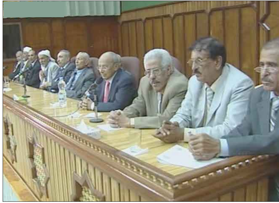
رئاسة اللقاء التشاوري لمتناضلي الثورة اليمنية