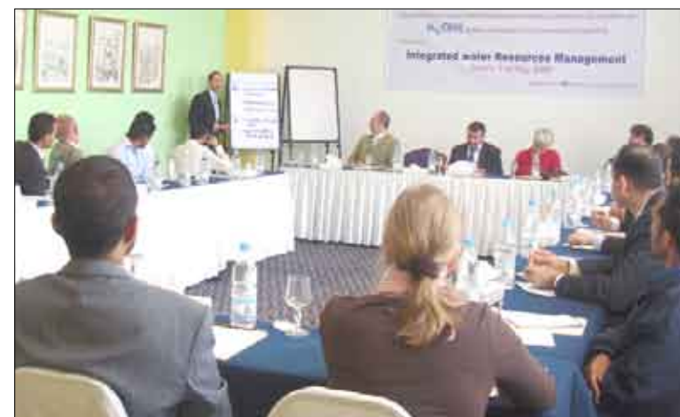
من ورشة حول الإدارة المتكاملة أمس

وقالت: نحن ندعم قطاع المياه في اليمن دعم مادي ومعنوي، ونحن الآن في صدد مشروع جديد مشترك في ألمانيا وهولندا والبنك الدولي ومستقبلاً ستكون بريطانيا في الموارد المائية ونحن في طور الإعداد النهائي له والذي يتوقع أن يبدأ نهاية العام الجاري.