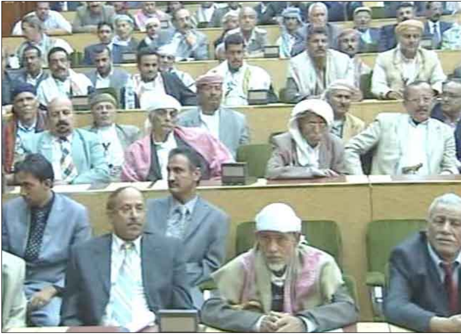
مشاركون في اللقاء التشاوري

الدولة بجل عاجل وإجراءات جادة لضبط أسعار المواد الغذائية، وأوصى البيان بتنفيذ البرنامج الانتخابي لفخامة الأخ الرئيس نصاً وروحاً وعلى جميع المستويات وضرورة قيام الحكومة وكل مؤسسات الدولة بدورها في التجسيد الخلاق لمضامين البرنامج، والمطالبة بحاسبة المقصرين بواجباتهم علناً وكشفهم بوسائل الإعلام المختلفة، والتصدي لكل الوسائل التي تروج لثقافة الحقد والكراهية، وتحسين أوضاع المناضلين وأسرى الشهداء .