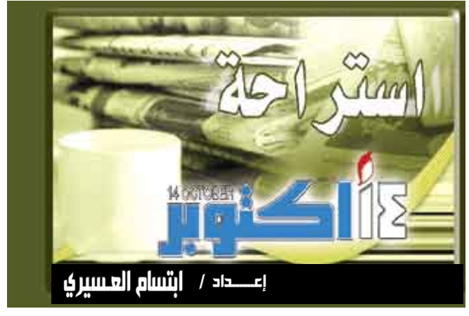
إعداد / إنشام العسيري

وقال بيدر ان اوباما يسعى للعمل مع الصينيين للتصدي لازمة الاقتصادية العالمية مثلما فعل هو ونظيره الصينى هو جينتاو عندما التقيا في لندن الشهر الماضى في قمة مجموعة العشرين للدول الصناعية وكبرى الدول التامية. وأضاف «الرئيس اوباما ينظر الى الصين باعتبارها لاعبا عالميا رئيسيا.. زعيما. لا يرى الصين تهديدا حتميا او عدوا..» وتابع قوله «نعتقد انه يتعين ان تلعب الصين دورا رائدا وان تتحمل مسؤوليات تتناسب مع ذلك الدور».