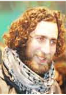
الشاعر الفلسطيني غياث المدون