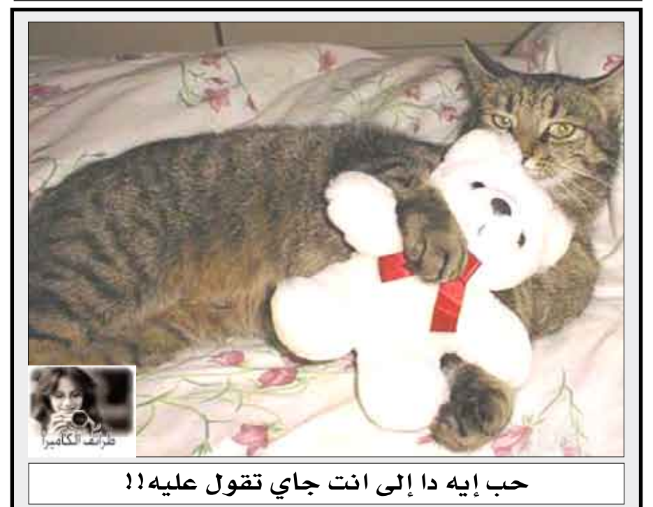
حب إيه دا إلى انت جاي تقول عليه!!