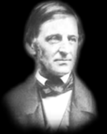
مايو جرد إمامنا ومايو جرد خلفنا يعتبر ضئيلاً إذا قارناه بما يوجد بداخلنا . رالف والدو امرسون