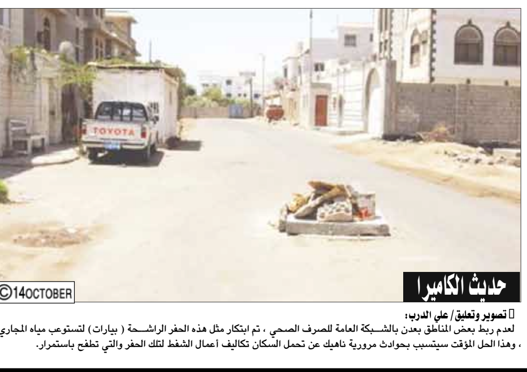
حدث الكاميرا تصوير وتعليق / علي الدرب: لعدم ربط بعض المناطق بعدن بالشبكة العامة للصرف الصحي ، تم ابتكار مثل هذه الحفر الراشحة ( بيارات ) لتستوعب مياه المجاري ، وهذا الحل المؤقت سيستبب بجوانب موروثة تهاجم عن تحمل السكان تكاليف أعمال الشطف لتلك الحفر والتي تطفح باستمرار.