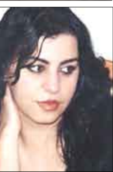
الشاعرة الليبانية / سمير دياب