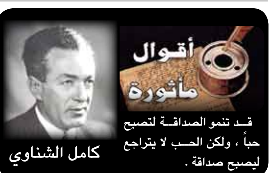
أقوال مأثورة قد تنمو الصداقة لتصبح حبا ، ولكن الحب لا يتراجع كامل الشناوي ليصبح صداقة .

وعندها بدأت تبحث عن صاحب الطرد لإخباره بضرورة الحضور إلى دائرة البريد لفتح الصندوق. وبحسب صحيفة «الشرق الأوسط» حضر الشخص المعني في اليوم التالي، واعترف بأنه كان يريد أن يرسل أفعى إلى مدينة برشلونة، شمالاً، فوضعها طيلة هذه الفترة.