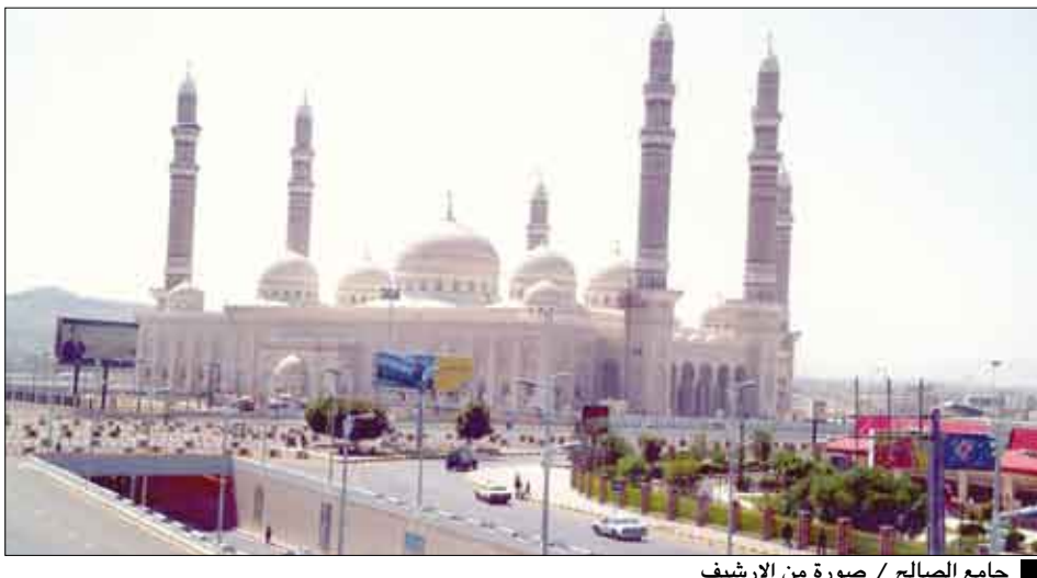
جامع الصالح

صنعاء / سبأ : حذر خطباء مساجد في عموم محافظات الجمهورية أمس في خطبتي الجمعة من التماهي في استهداف وحدة الوطن وأمنه واستقراره. وأدان الخطباء وبشدة أعمال التخريب وأحداث الشغب والفضوى والاعتداءات التي طالت الممتلكات العامة والخاصة في زنجبار وردفان والمكلا ، ومحاولة دغاة الفتنة زرع الأحقاد والضغائن ونشر ثقافة الكراهية بين أبناء الشعب الواحد. وأكد الخطباء أن أبناء اليمن الواحد اليوم مدعوون إلى الوقوف صفاً واحداً في مواجهة أعمال التخريب ومشاريع الفرقة والانقسام مستشهدين بقوله تعالى // واعصموا بجيل الله جميعاً ولا تفرقوا وانكروا عصمة الله عليكم إذ كنتم أعداء فألف بين قلوبكم فأصبحتم بنعمته إخوانا// . وأشار خطباء