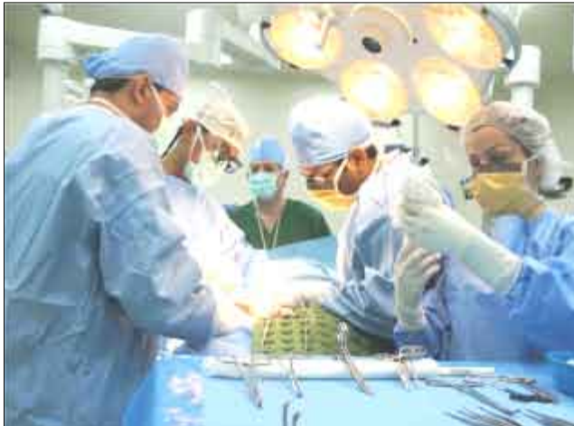
أثناء استئصال الورم باستخدام التقنية الجديدة

ونصف ساعة، مشيراً إلى أن العمليات التقليدية بدون استخدام هذه التقنية الجديدة تستغرق نحو ثلاث ساعات تقريباً. وذكر أن الكويت تتميز في منطقة الخليج بوجود نخبة من الأطباء من ذوي الخبرة في مجال الأنف والأذن والحنجرة، مؤكداً أن استخدام أحدث التقنيات الطبية يساعد على تطوير الخدمات الصحية في الكويت واكتساب خبرات جديدة للأطباء الكويتيين. وأشاد العبد الهادي باهتمام وزارة الصحة وحرص القيادة السياسية في البلاد على الاستمرار في تطوير الخدمات الطبية من خلال توفير أحدث التقنيات والأجهزة الطبية المتقدمة. وذكر أن مستشفى زين قام بإجراء العديد من العمليات الصعبة والمعقدة من خلال استخدام أحدث المعدات الطبية المتطورة إضافة إلى استضافته العديد من الخبراء والأخصائيين خلال الفترة الماضية لتحسين جودة الخدمات المتاحة وتبادل الخبرات مع الأطباء العالميين.