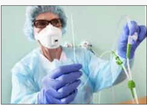
عيادات صحية للطوارئ في مطارات السعودية

«لا خنازير في السعودية، لأن الإجراءات الاحترازية تجاه إنفلونزا الخنازير يجب أن تكون على أعلى معايير الرعاية الصحية، كما