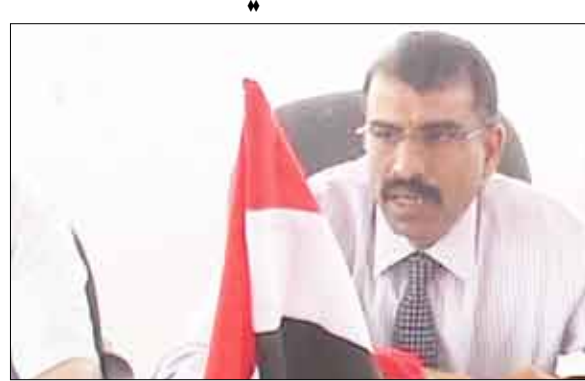
محافظ المهرة علي محمد خردوم خلال ترؤسه اجتماع المكتب التنفيذي

تنفيذ المهرة يناقش قضايا متصلة بنشاط قطاعي الصحة والأسماك