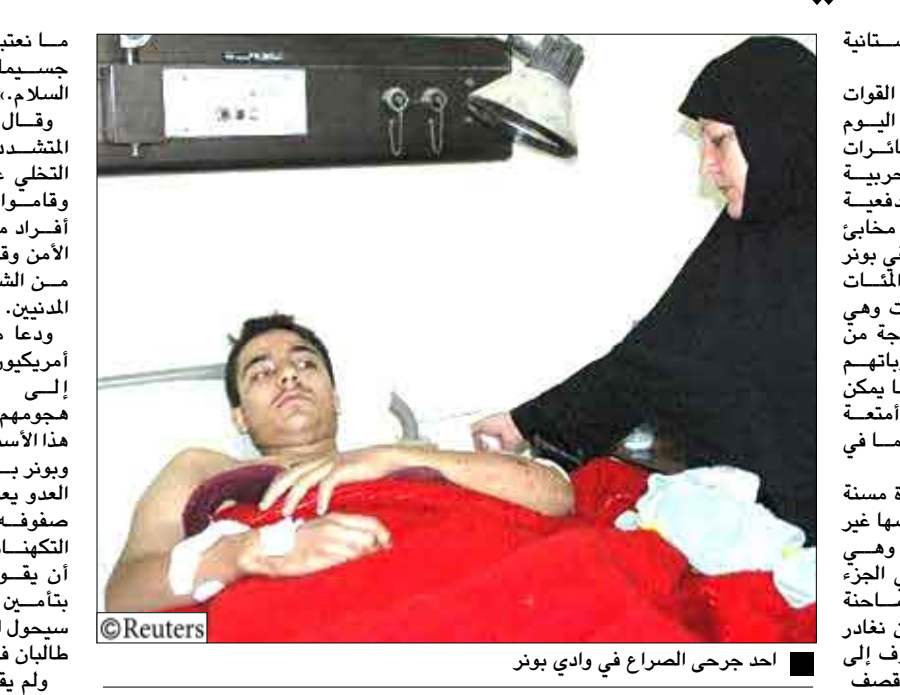
أحد جرحى الصراع في وادي يونر