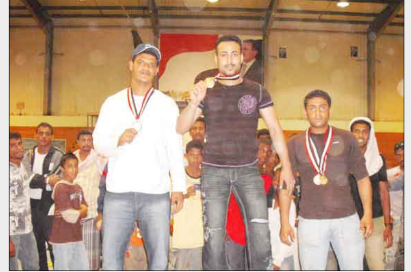
لقطات من البطولة