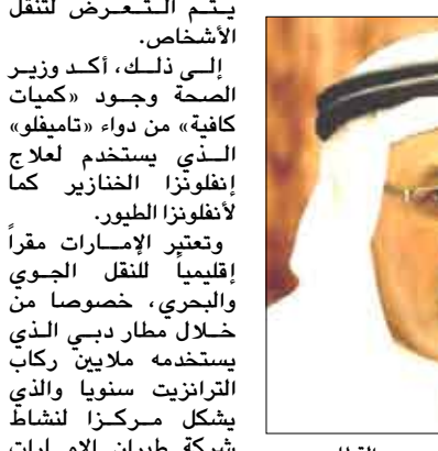
وزير الصحة الإماراتي حميد القطامي

وأضاف «تقوم بتحديد نقاط الإبوخ إلى البلاد، واعتباراً من الأسبوع المقبل سنطبق أنظمة المراقبة والرصد» على أن يشكل اجتماع السبب في الدوحة «شراكة انطلاقاً».