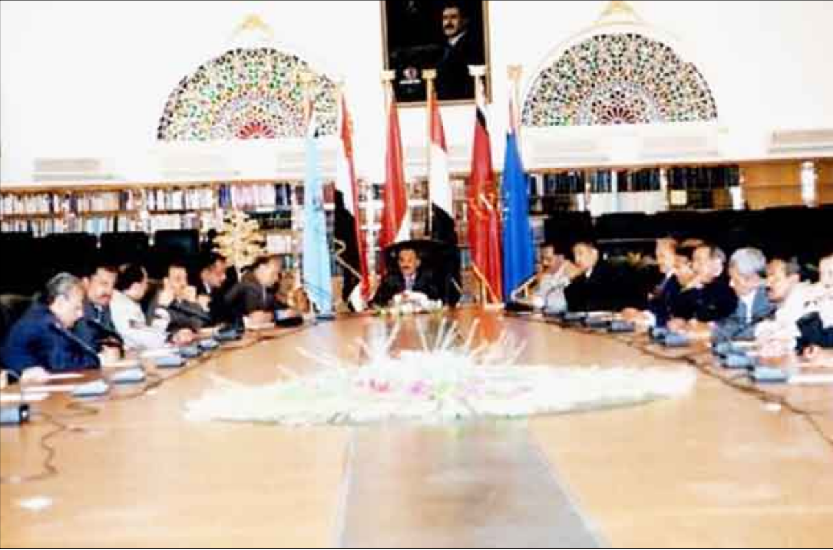
الأمانة العامة للمؤتمر الشعبي

دعوة كافة القوى الوطنية إلى تحمل مسؤولياتها في التصدي للأعمال الإجرامية والإبلاغ عن العناصر التخريبية والإرهابية