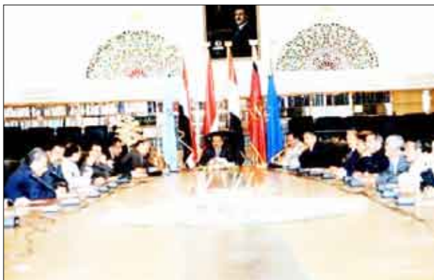
الامانة العامة للمؤتمر الشعبي العام / ارشيف