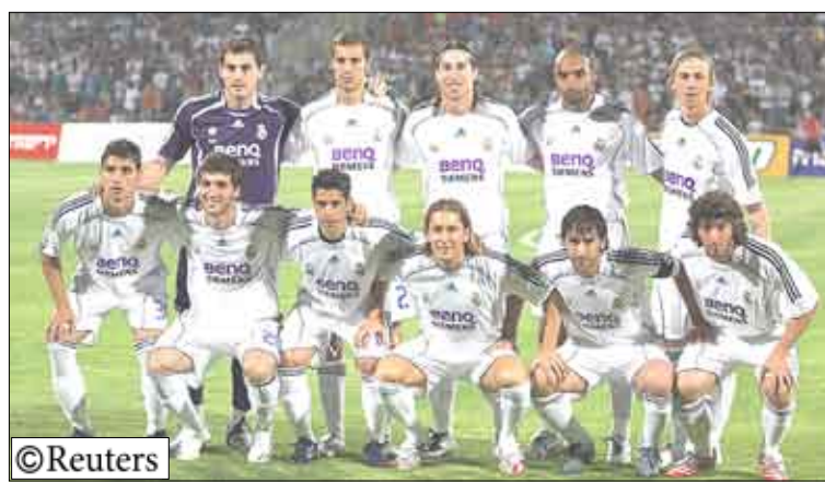
فريق ريال مدريد