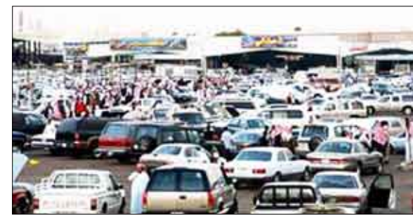
سوق السيارات المستعملة

ووافق المجتمعون وهم من كبار مستوردي السيارات المستعملة على رفع ضغطاً إلى الهائل السعودي الملك عبد الله بن عبد العزيز لتوضيح آثار القرار على المستهلكين، خاصة أصحاب الدخل المحدود، حيث سيؤدي القرار إلى ارتفاع أسعار السيارات بشكل كبير. وحذروا من أن القرار سوف يقضي على استثمارات عدد كبير من رجال الأعمال مستوردي السيارات المستعملة، إذ إن عدد كبير منهم لا يستطيعون استيراد الموديلات الجديدة التي لم يرض على تصنيعها خمس سنوات بسبب ارتفاع أسعارها. يذكر أن عدد السيارات المستعملة