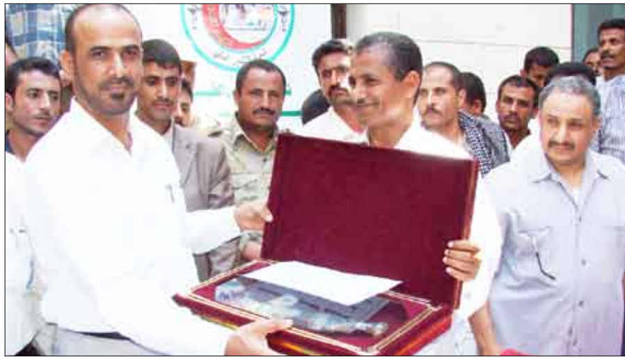
خلال تكريم الأطباء والفنيين والعاملين في المخيم