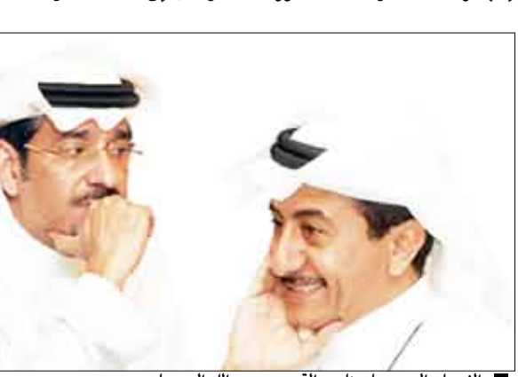
النجمان السعوديان ناصر القصبى وعبدالله السدحان

الرياض/متابعات: انطلقت صباح الأربعاء في مزرعة النجم عبدالله السدحان خارج مدينة الرياض كاميرا المخرج هشام شربجي لتصوير أحداث الجلس السادس عشر من المسلسل الجماهيري طاش ما طاش، ومن المقرر أن يستمر التصوير هناك لمدة عشرة أيام. وقد قام المخرج مؤخراً بزيارة ميكرو للمركز للتعرف على طبيعة موقع التصوير والذي تم تجهيزه لإنتاج الحلقات والمشاهد المقرر