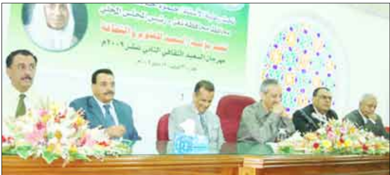
أثناء تدشين الفعاليات الثقافية في مؤسسة (السعيد) الثقافية

تحدث عن إدارة مجموعة هائل سعيد انعم على بداية انطلاق مهرجان السعيد الأول الذي تزامن مع تدشين مهرجان السعيد الثقافي يسهم بشكل كبير وفعال في النهوض بالثقافة في مجالات العلوم والآداب والفنون وقد تطور هذا المهرجان وتنوعت أنشطته وفعالياته ليضم المحاضرات والندوات ومعارض الفنون التشكيلية وغيرها بالإضافة إلى جوائز المرحوم الولد الحاج هائل سعيد انعم للعلوم والآداب ومعرض تعز الدولي للكتاب . ونوه شوقي بان ما يلزم على هذا العرض هو التطور عاما بعد عام ويسعى هذا المهرجان إلى تحقيق التواصل والحوار حول الأفكار والرؤى والإبداع في مختلف الميادين