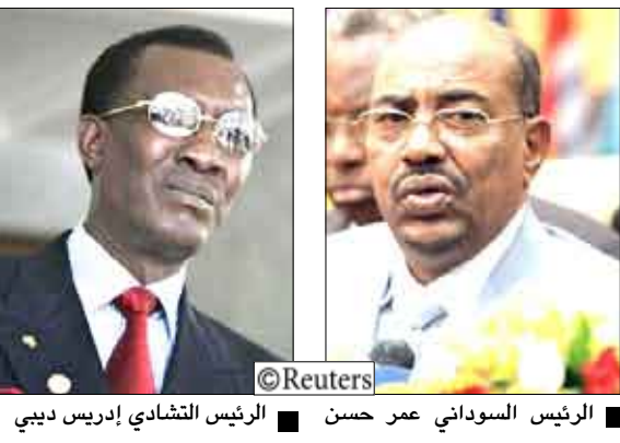
الرئيس السوداني عمر حسن ■ الرئيس التشادي إدريس ديبي

وفي السياق نفسه صرح مطرف الصديق وكيل وزارة الخارجية السودانية لوكالة الأنباء القطرية بأنه خلال المحادثات التي بدأت أمس الأول الأربعاء في الدوحة تحت رعاية قطرية وليبية ستجري مراجعة الجوانب الإيجابية والسلبية في الاتفاقيات السابقة للوصول إلى حل دائم، مضيفاً «سنعمل مع الأجهزة في تشاد لإيجاد حلول سلمية دائمة لقضايا تشاد حتى لا تنعكس سلباً على السودان.» ويصرخ خبراء دوليون إن الحدود التي يسهل اختراقها بين السودان وتشاد ساهمت في عدة صراعات بما في ذلك حرب أهلية في منطقة دارفور السودانية التي أسفرت عن سقوط نحو 200 ألف قتيل ونزوح 2.5 مليون آخرين منذ اندلاعها عام 2003.