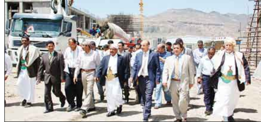
لدى زيارة الراعي مشروع مبنى مجلس النواب الجديد