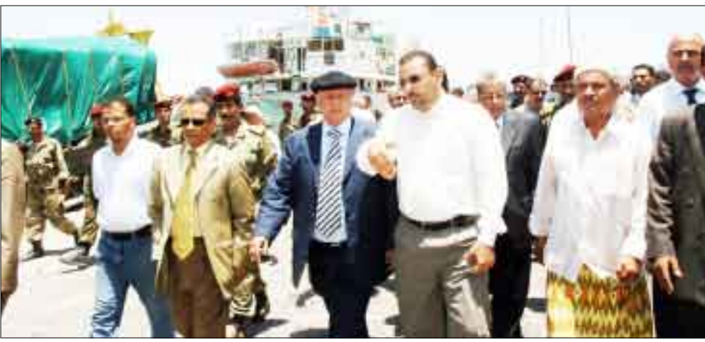
نائب الرئيس أثناء زيارته ميناء الخوخة أمس الأول