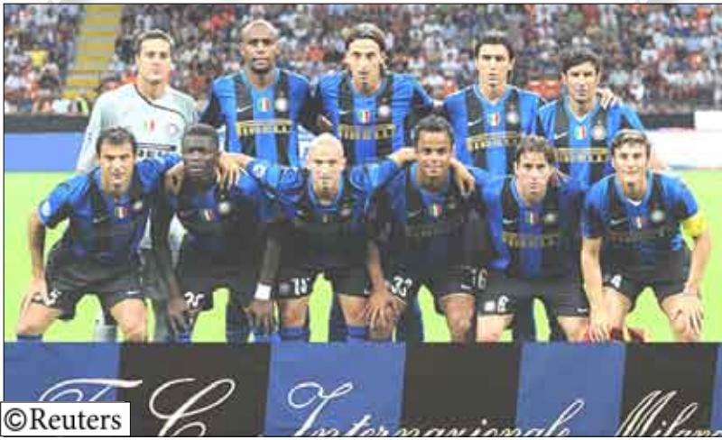
فريق انتر ميلان