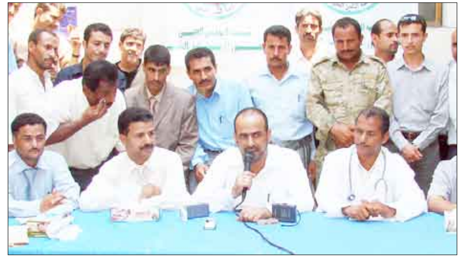
محافظ أبين م / أحمد الميسري في اختتام فعاليات المخيم الطبي 22 مايو

تأهيل "21" اختصاصياً اجتماعياً في المحويت إعادة توزيع (32) تربوياً على مدارس التعليم بمديرية الطويلة