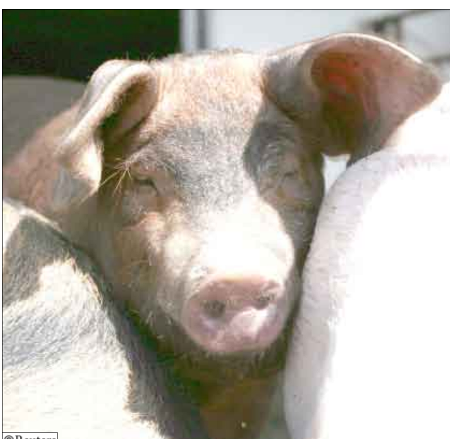
أنفلونزا الخنازير هل ستقضي عليه الدول الكبرى

وأضاف أن مراكز مقاومة الأمراض والوقاية منها أرسلت مستلزمات اختبار إلى الولايات الأمريكية ستتيح لمعامل كل ولاية تأكيد ما لديها من حالات لأنفلونزا الخنازير. وقال بيسر «نحن نقيم بتوفير القدرة على الاختبار في كل ولاية.» وفي واشنطن قال مسؤولون أمريكيون يوم أمس الخميس إن إجمالي عدد الإصابات المؤكدة بأنفلونزا الخنازير في