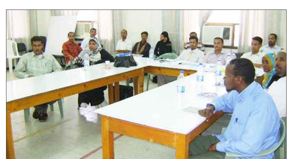
جانب من حضور ورشة عمل الباحثين