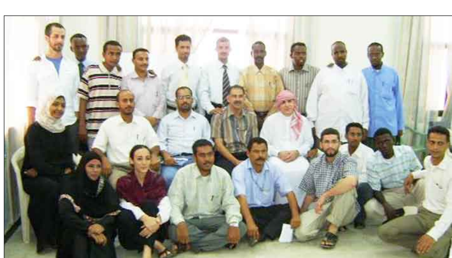
المشاركين في ورشة عمل الباحثين

اختتام ورشة عمل للباحثين الاجتماعيين والمتعاملين مع اللاجئين الصوماليين