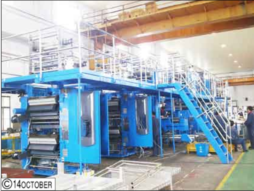
جانب من الوحدات الطباعة ذات اللون الواحد واللونين أثناء التصنيع حالياً