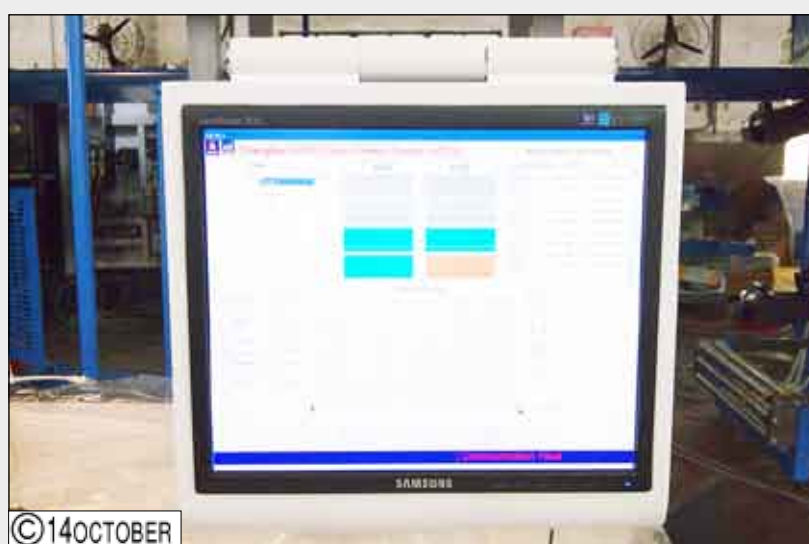
شاشة منصة التحكم رقم (2)

رأسى 2 × 2 HI مصممة للطباعة بلون واحد أو لونين لكل ويب (أربع صفحات بالقطع الكبير)، بحسب متطلبات واحتياجات الإنتاج . وتميز الوحدات الطباعة بأنها مجهزة بنظام ضبط زوايا الريجسترات بواسطة وحدة التحكم عن بعد GOSS REGISTER SYSTEM . كما تحتوي آلة الطباعة الصحفية الجديدة على وحدة التعطيف (40 GOSS MAGNUM N) ، وهي أحدث وحدة للتعطيف تنتجها مصانع جوس الشهيرة عالمياً في مجال صناعة آلات الطباعة الصحفية حيث تستوعب هذه الوحدة (12 WEB) بما يساوي 48 صفحة من القطع الكبير وبسرعة 35 ألف نسخة في الساعة، ومجهزة أيضاً لاستيعاب 6 WEB عند الطباعة بمقاس A4