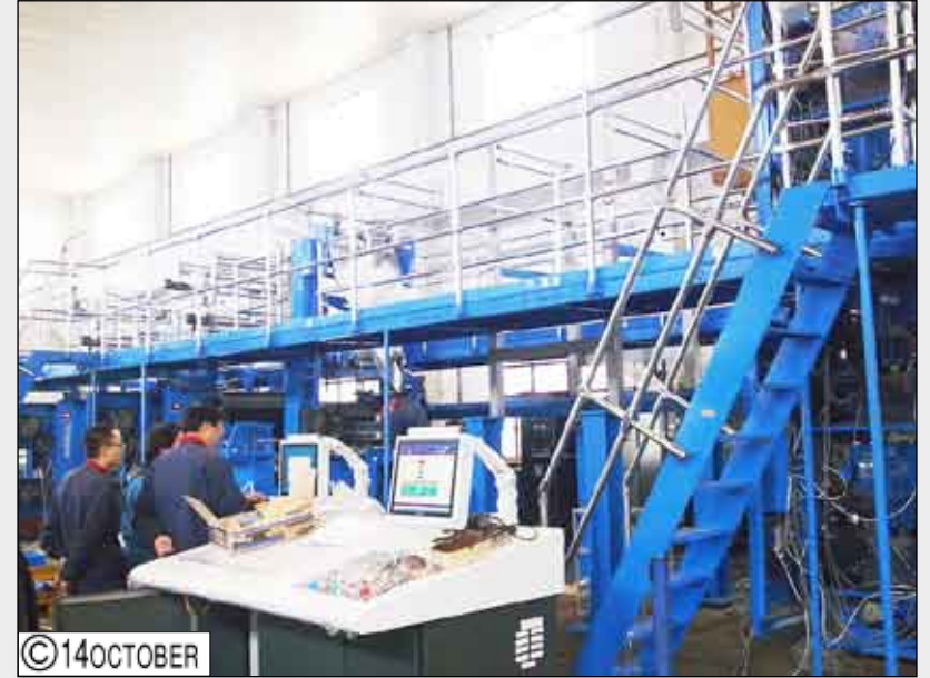
جانب من مسارات الورق أثناء تصنيع آلة الطباعة الصحفية الخاصة بصحيفة «14 أكتوبر»