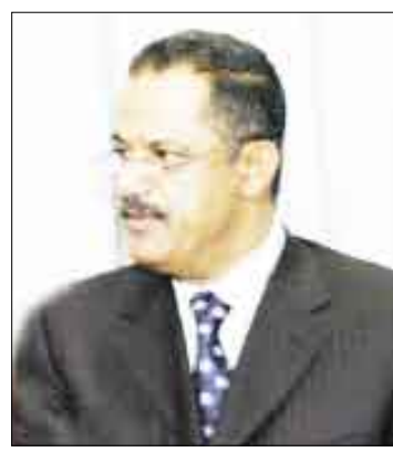
د. علي مجور

□ صنعاء /14 أكتوبر/، قال الدكتور علي محمد مجور ان يوم السايح والعشرين من ابريل سيظل يوماً خالداً في تاريخ شعبنا اليمني ، الذي ترجم فيه ارادته الحقيقية في تجسيد النهج الديمقراطي والأساليب الشمولية التي عانى منها شعبنا الأميين، وذلك بالاحتكام إلى صناديق الاقتراع في اول انتخابات نيابية تنافسية في اليمن اسفرت عن اختيار اول برلمان ديمقراطي في دولة الوحدة. وأكد رئيس الوزراء ان الحكومة وتنفيذاً لتوجيهات فخامة الاخ الرئيس علي عبدالله صالح رئيس الجمهورية، سيتمضي قدماً في تعزيز وتطوير التجربة الديمقراطية، باعتبارها الطريق الأمثل لتحقيق التطور والتقدم لبلادنا وعلى كافة الصعد، مشدداً على ان الديمقراطية هي الخيار الناجح لمواجهة مثيري النزعات المنطقية والجهوية ودعاة الكراهية والبغضاء، الذين يسعون لاعادة عجلة التاريخ إلى الوراء. وأوضح رئيس الوزراء في تصريح نشرته صحيفة «الميثاق» في عددها اليوم - ان ما يقوم به المازومون في بعض مناطق المحافظات الجنوبية من اعمال فوضى وشغب واقلاق للامن والاستقرار والسكينة العامة يزيدنا اصراراً وثقةً بسلامة نهجنا الديمقراطي ، كخيار لمواجهة اصحاب العقول والافكار الظلامية التي لم تعد تصلح لاي زمن من الأزمان ، لانها تسير عكس التطور الطبيعي للمجتمع اليمني والبشرية جمعاء ،