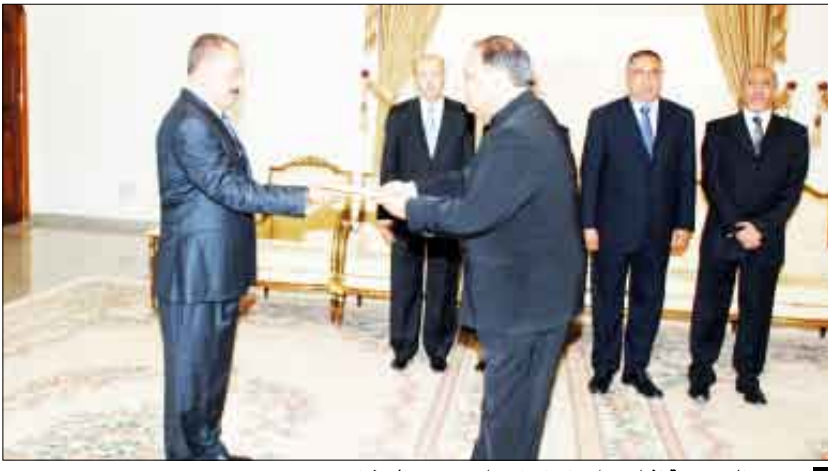
رئيس الجمهورية اثناء تسلمه اوراق اعتماد عدد من السفراء

□ صنعاء /سبا/، تسلم فخامة الأخ الرئيس علي عبدالله صالح رئيس الجمهورية أمس أوراق اعتماد سفراء كل من المغرب، الهند ، تركيا ، موريتانيا ، مالي وسيريلانكا كسفراء معتمدين لبلدانهم لدى اليمن. وقد التقى فخامة الأخ الرئيس بالسفراء كل على حدة حيث تلقوا لفخامته تحيات قادة دولهم وتمنياتهم له بمغور الصحة والسعادة وللشعب اليمني اضطراب التقدم والازدهار وللعلاقات الثنائية بين بلادنا وبلد كل منهم المزيد من التقدم والتطور . كما جرى بحث جوانب العلاقات الثنائية ومجالات التعاون المشترك وسبل تعزيزها وتطويرها ولما فيه تحقيق المصالح المشتركة للشعب اليمني وشعبوب دولهم الشقيقة والصديقة . وخلال تلك اللقاءات أكد السفراء حرصهم على بذل أقصى الجهود خلال فترة عملهم في اليمن من أجل خدمة العلاقات وتطوير مجالات التعاون المشترك بين اليمن وبلد كل منهم . التفاصيل 3ص