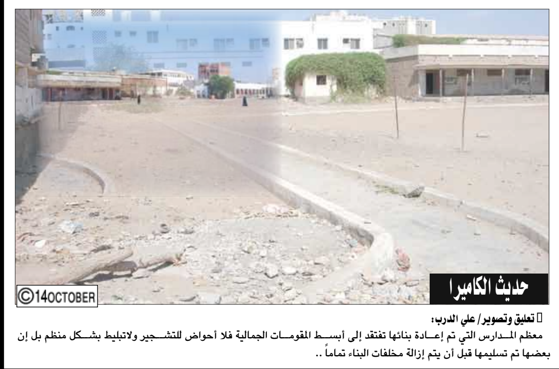
حديث الكاميرا تعلق وتصوير/ علي الدرب: معظم المدارس التي تم إحصاء بنائها تفقدت إلى أبسط المقومات الجمالية فلا أحواض للتشجير ولا تبليط بشكل منظم بل إن بعضها تم تسليمها قبل ان يتم إزالة مخلفات البناء تماما..