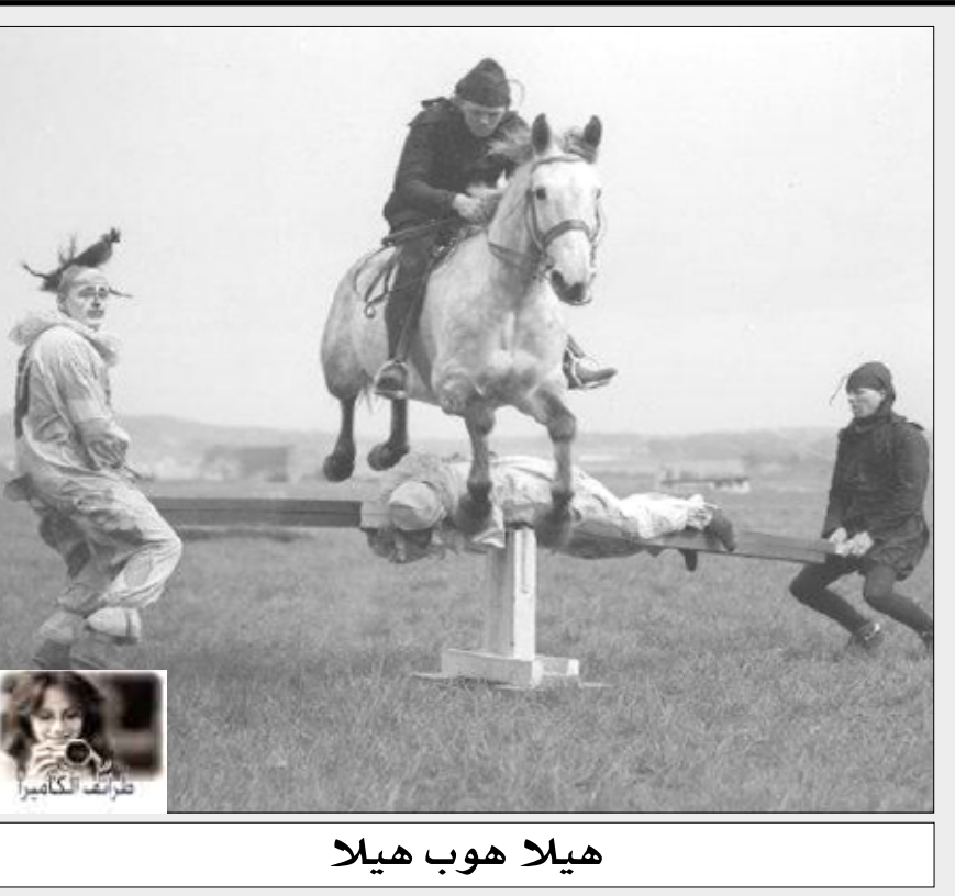
هيلدا هوب هيلدا

أفقيا 1- سياسي وأديب مصري رئيس الحزب الوطني خلفا لمصطفى كامل من كبار المناضلين في سبيل استقلال مصر من كتبه (تاريخ الرومانيين) و(تاريخ الدولة العثمانية) - مدينة فرنسية. 2- عملة - بلد آسيوي. 3- مدينة مصرية بمحافظة البحيرة - من الطيور. 4- حرف جر - داني - لقب. 5- خوف - ملكة هولندا للفترة 1948 م - 1980 م تنازلت لها والدتها فلهلمينا وتنازلت هي لابنتها بياتريس. 6- مدينة في أفريقيا الجنوبية يوجد فيها مناجم ذهب - حيوان من فصيلة الدب. 7- كف - صديق - يابسة. 8- من أشهر الصحف اللبنانية - فر. 9- ريعان - بلد عربي - للنداء. 10- حب - خير - للاستفهام. 11- سارق - للاستفهام - هناء. 12- بلد أوروبي - خير وبركة. عموديا 1- هي القائلة (أيتها الحرية كم من الجرائم ترتكب بأسمك) وذلك عند شقنقا - للنفي. 2- طليق - حذاء - جمع لص.