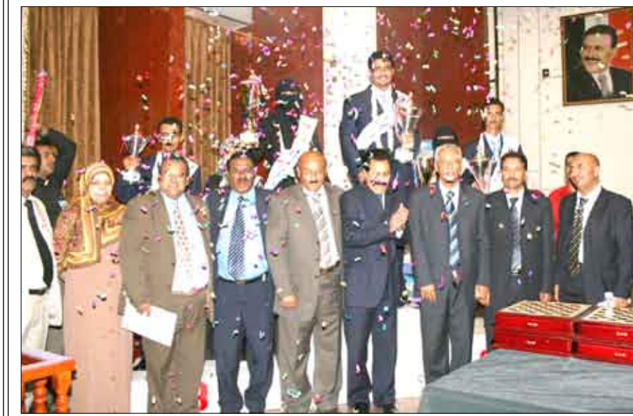
لقطة من اختتام بطولة كمران الثامنة