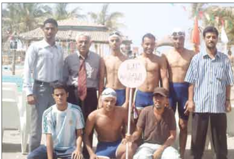
كلية العلوم الإدارية