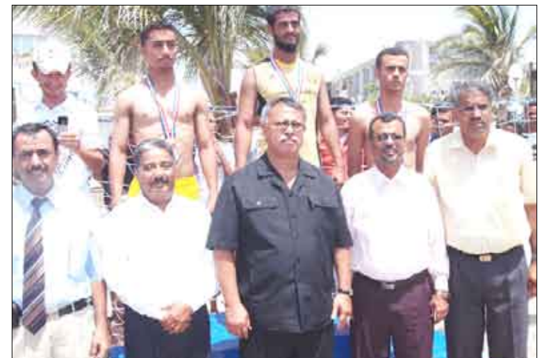
لقطة تذكارية لقيادة الجامعة مع أبطال السباحة