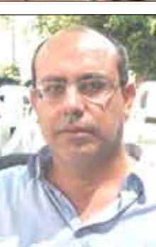
الشاعر / حسين حمزة