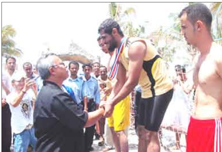
رئيس جامعة عدن يكرم احد الفائزين