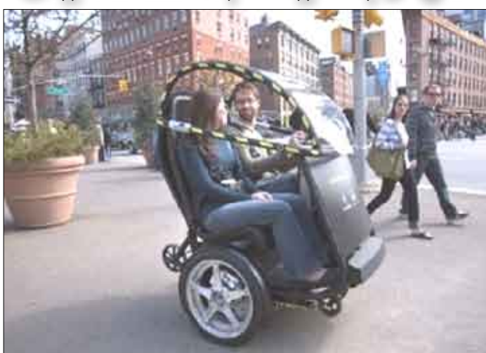
وطيارات تعمل لمسافة 56 كيلومترا في دفعة واحدة، كما تم وصفها بأنها ذكية وعملية وصديقة للبيئة.

قامت شركة Segway المتخصصة في مجال التنقل الحضري بفرنسا في شراكة مع مؤسسة جنرال موتورز بابتكار دراجة كهربائية ذات مقعدين من طراز بوما مقعدين، وتم تقديم هذا التصميم كحل مستقبلي للقضاء على زحمة المرور في العواصم الكبرى. يوما متكونة من عجلتين ومقعدين ووفقا لـ Segway، وجنرال موتورز، يمكن لها أن تسمح للناس في جميع أنحاء المدينة بالوصول على وسيلة تنقل أسرع وأكثر هدوءا وأكثر نظافة، وبسرعة قصوى تقدر بـ 56 كم / ساعة،