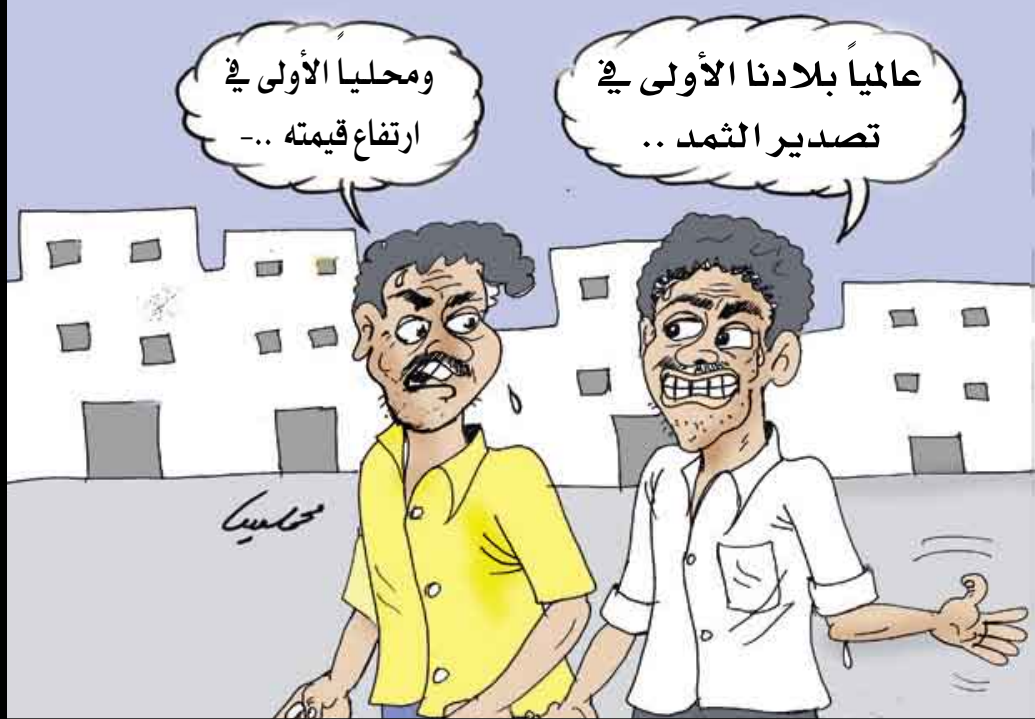
عالميا بلادنا الأولى في تصدير الثمد.. ومحلنا الأولى في ارتفاع قيمته...