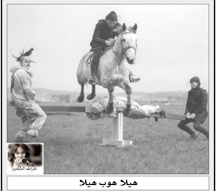
هيلا هوب هيلا

عموديا 1- هي القائلة (ابتها الحرية كم من الجرائم تركت بأسمك) وذلك عند شقها - للنفي . 2- طليق - حذاء - جمع لس .