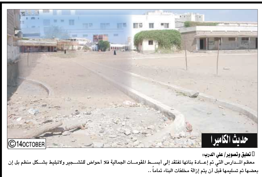
حديث الكاميرا تعلق وتصوير/ علي الدرب: معظم المدارس التي تم إعادة بنائها فتتعد إلى أبسط المقومات الجمالية فلا أحواض للتشجير ولا تيليط بشكل منظم بل إن بعضها تم تسليمها قبل أن يتم إزالة مخلفات البناء تماما ..