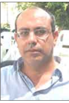
الشاعر / حسين حمزة