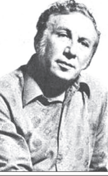
الشاعر/ نزار قباني

أغضب كما تشاء.. واجرح أحاسيسي كما تشاء حطم أواني الزهر والمرايا هدد بحب امرأةٍ سواي.. فكل ما تفعله سواء.. كل ما تقوله سواء.. فأنت كالأطفال يا حبيبي نحبهم.. مهما لنا أسوأوا.. أغضب! فأنت رائعٌ حقاً متى ثنور أغضب! فلولا الموج ما تكونت بحور.. كن عاصفاً.. كن ممطراً.. فإن قلبي دائماً غفور