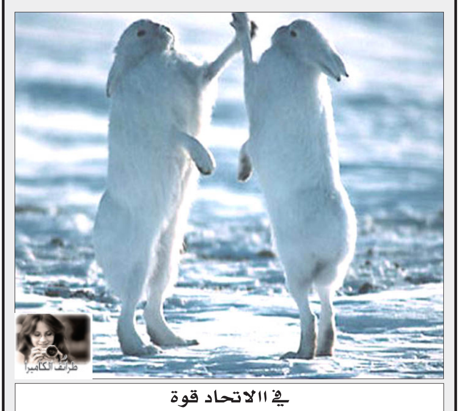
في الاتحاد قوة

أفقياً 1- أحد الخلفاء الراشدين لقب بالفاروق . 2- طريق متجهة إلى أعلى ( طريق يمر عبر الجبل ) - أكيد ( معكوسة ) . 3- مرادف امتحان - ضعف . 4- طرف المدينة - الحرف الهجائي رقم 20 . 5- فلكي ( مبعثرة ) - سلطة ، أو كلمة مصاحبة لكلمة قانون . 6- الاسم القديم لجمهورية هنجاريا + أمده . 7- من التقنيات الحديثة . 8- مصطلح مالي يستخدم في التداولات المصرفية ويحسب أنواع التجارة . 9- عود ذو رائحة عطرية - مساواة - حاجز مائي . 10- اشياء ثمينة - محافظة بمنية . 11- لين ( مبعثرة ) - من أنواع الخضار . 12- عالم امريكي مخترع قلم الجبر عام 1884م . عمودياً 1- ما توصف به كمية العنب المترابطة معاً في عرج واحد . 2- قم ( معكوسة ) - عكس ( جزر ) - مفرد حلول . 3- أحد الشهور السريانية ( مبعثرة ) - أحد الأبراج . 4- خليج مائي هام يقع في جنوب شرق اسيا . 5- رفضت ( معكوسة ) + أحد الانبياء عليهم السلام .