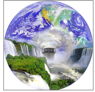
إعداد / أمل حزام

تتطلبه تلك المحاصيل من ظروف مناخية تساعدها على النمو بشكل طبيعي. وأضاف الدكتور علوان أن سقوط كميات من الأمطار له الأثر في إحداث تقلبات جوية تستدعي من المزارعين معرفتها بدقة في ظل ما تشهده بلادنا خلال الفترة الأخيرة من تغيرات مناخية تأتي ضمن التغير المناخي الذي يشهده العالم الناتج عن كثير من المسببات والمشاكل لعل من أبرزها الاحتباس الحراري الذي تواجه البشرية. كما تطرق مدير عام محطة البحوث الزراعية بسينون إلى