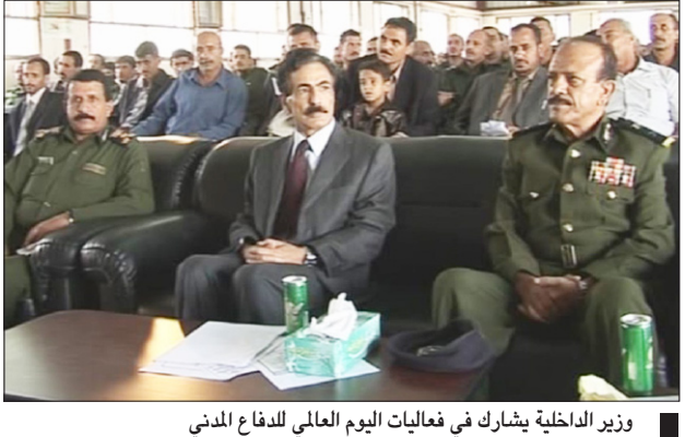
وزير الداخلية يشارك في فعاليات اليوم العالمي للدفاع المدني

صنعاء / سبأ: قال وزير الداخلية اللواء الركن مطهر رشاد العمري «إن الكوارث سواء كانت طبيعية أو من صنع البشر قد تأتي في أي زمان أو مكان الأمر الذي يتطلب الاستعداد المستمر لمواجهة ما تسببها من قبل المؤسسات الحكومية ذات العلاقة أو من قبل منظمات المجتمع المدني وكافة الفئات الاجتماعية». وأشار في كلمته في اختتام فعاليات اليوم العالمي للدفاع المدني يوم أمس الذي نظمه وزارة الداخلية مع وزارة التربية والتعليم وعدد من منظمات المجتمع المدني بجهود مصلحة الدفاع المدني في مواجهة الكوارث.