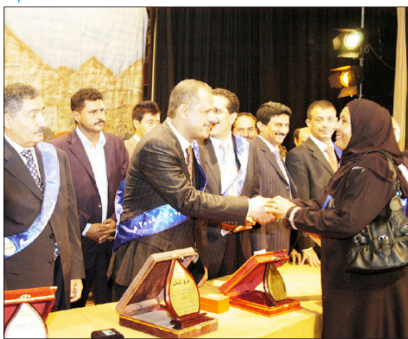
.. ويكرم احد المعلمات المثاليات