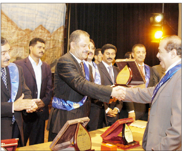
مجور بكرم مستشار رئيس الجمهورية وزير التربية الاسبق د. السلامي

صنعاء / سبأ: أكد رئيس مجلس الوزراء الدكتور علي محمد مجور أن التعليم يحظى بمركز الصدارة في البرنامج العامل للحكومة، باعتبار التعليم حقاً من الحقوق التي كفلها الدستور والقوانين النافذة لكل مواطن ومواطنة.. إلى جانب كونه استثماراً طويل المدى، ولما له من أهمية في التنمية الاقتصادية والاجتماعية.. وأوضح لدى حضوره الحفل السنوي الذي تنظمه وزارة التربية والتعليم لتكريم كوكبة من المعلمين المبرزين احتفاءً بيوم المعلم، أن الدولة عملت على التوسع في التعليم ونشره، إلى جانب تبنيها استراتيجيات وخططاً قصيرة ومتوسطة وطويلة المدى تعمل على تنفيذها.. مشيراً إلى ما أولته الدولة خلال مراحل تطور النظام التعليمي، من اهتمام خاص بالمعلم، اعداده وتدريبه وتأهيله ومكانة وتحفيزه.. وأكد الدكتور مجور على أهمية تكريم المعلمين المبرزين الذين يمثلون رصداً للتعليم وسائر المعلمين، وعرافته وتقديره بدور المعلم ورسالته السامية التي يؤديها في تنشئة الأجيال.