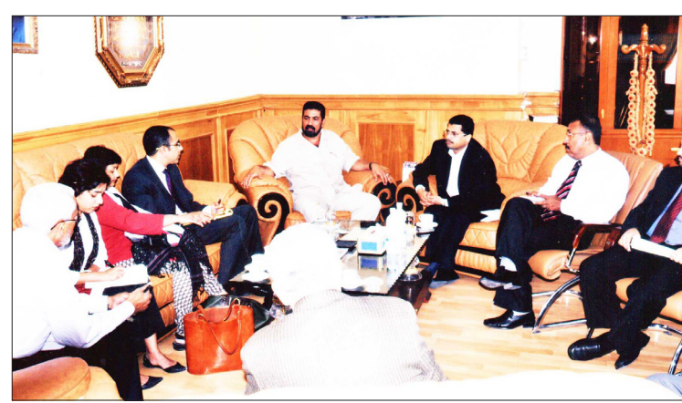
د. الجفري يلتقي بفريق البنك الدولي

عدن / واد شبلي: أوضح الدكتور عدنان عمر الجفري، محافظ عدن ان هناك دراسة تجري حالياً لنقل محطة الحسوة بمديرية البريقة إلى منطقة العريش بمديرية خورمكسر وذلك في إطار عمل توسعات وإضافات للشبكة الكهربائية للحد من انقطاع التيار الكهربائي. جاء ذلك خلال لقاء محافظ عدن أمس بفريق البنك الدولي برئاسة دييالي يتواري، خبير التنمية الحضرية في البنك، وجرى خلال اللقاء بحث إمكانية مساهمة البنك في تنفيذ عدد من المشاريع في مجال البنية التحتية بالمحافظة وخاصة توليد الطاقة الكهربائية.