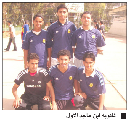
ثانوية ابن ماجد الاول

□ سقطرى/ فهمي باحمدان : أنهى أبطال بطولة كمران الشطرنجية الثامنة مساء أمس الثلاثاء رحلتهم السياحية الترفيهية إلى أرخبيل جزر سقطرى التي أقامتها لهم شركة كمران بمناسبة توجيهم أبطالاً للبطولة الثامنة التي يقيمها نادي كمران الرياضي سنوياً اختتم برنامج الرحلة يوم أمس بزيارة إلى مقر الهيئة العامة لحماية البيئة وهناك تعرف الشباب من الأ/ع/ سالم على دهن مدير عام فرع الهيئة في الجزيرة على خطة صون وتنمية الأرخبيل وما تتمتع وتنتمي من بيئته وطبيعته وآلاف النباتات