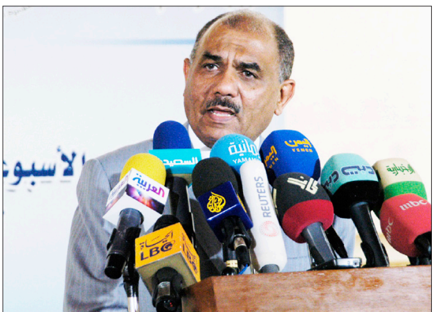
مجلس الوزراء في اجتماعه الأسبوعي أمس برئاسة الدكتور علي محمد مجور

أعلن الناطق الرسمي باسم الحكومة - وزير الإعلام حسن اللوذي، عن ضبط أجهزة الأمن اثنين من المتهمين بالتورط في عملية اختطاف الخبير الهولندي وزوجته في منطقة بني ضبيان مؤخرًا. وقال الناطق الرسمي في المؤتمر الصحفي الأسبوعي الذي عقده أمس: « تم تسليم أحد الخاطفين والقاء القبض على آخر في محافظة أخرى.. مؤكداً أن أجهزة الأمن مازال تحاصر منطقة الخاطفين والعملية الأمنية مستمرة حتى يتم ضبط بقية المتهمين. ويشدان مدى صحة ما يتشاع من أخبار التحضير لنقل العاصمة السياسية