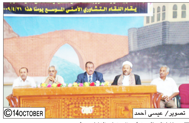
محافظ الضالع يترأس الاجتماع التشاوري أمس