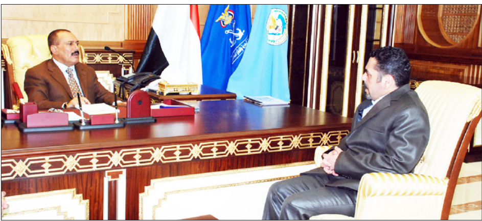
رئيس الجمهورية أثناء استقباله سفير القنطار أمس

استقبل فخامة الرئيس علي عبدالله صالح رئيس الجمهورية أمس عبد الأسرى العرب في السجون الإسرائيلية سفير القنطار الذي نقل لفضائله رسالة من الأمين العام لحزب الله اللبناني الأخ حسن نصر الله. وتناولت الرسالة العديد من القضايا والتطورات الراهنة في المنطقة والقضايا التي تهم الأمة العربية. وثمن نصر الله في رسالته مواقف اليمن الداعمة للمقاومة اللبنانية في مواجهة الاحتلال الإسرائيلي وفي مقدمتها الموقف اليمني أثناء العدوان الإسرائيلي على لبنان في صيف 2006 .. معتبراً تلك المواقف بأنها مواقف