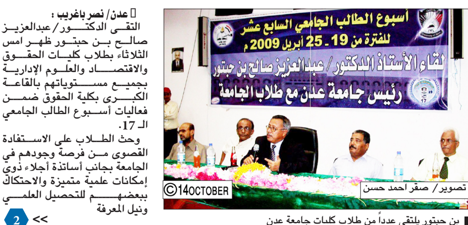
بن حبتور يلتقي عدداً من طلاب كليات جامعة عدن