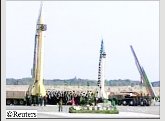
من ترسانة الاسلحة الروسية

موسكو/14 أكتوبر/اوج شيدروف: ذكرت وكالة (إترفاكس) للأخبار أن روسيا هدت أمس الاثنين بإعلاء اجتماع لقيادة عسكريين بارزين مع حلف شمال الأطلسي مقر في الشهر القادم إذا مضى الحلف في تنفيذ تديراته المزمعة في جورجيا الدولية السوفيتية السابقة. ونقلت (إترفاكس) عن ديمتري روجوزين قوله "إذا لم نجد ردا (على احتجاجات روسيا بشأن التديرات) فإن اجتماع رؤساء الأركان لروسيا ودول حلف شمال الأطلسي المقرر يوم السابع من مايو ايار لن يتعقد". وأضاف المتحدث باسم حلف شمال الأطلسي جيمس إلتورتاي إنه لا توجد خطط لإلغائه التديرات. وقال "لم يتغير شيء بالنسبة للحلف. وسيتم عقد اجتماع رؤساء أركان الدفاع وروسيا مدعوة لحضوره والاستعدادات مستمرة لإجراء التديرات. وتم إبلاغ روسيا كمشريك للحلف بالاستعدادات الجارية لإجراء هذه التديرات على مدى عام كامل وينبغي أن نعرف بأنها لا تشكل أي تهديد لاستقرار المنطقة. واحتجت روسيا التي خاضت حربا قصيرة مع جورجيا في العام الماضي على خطط حلف شمال الأطلسي لإجراء سلسلة من التديرات الدولية قرب خليج في الشهر القادم. وحذر الرئيس الروسي ديمتري ميدفيدف حلف شمال الأطلسي بالفعل من أن التديرات ستعزل جهود إعادة علاقات الحلف إلى طبيعتها مع موسكو والتي علقت بعد حرب جورجيا. وجاء قرار روسيا وحلف شمال الأطلسي باستئناف عمل المجلس المشترك في إطار جهود "الضغط على زر إعادة الضبط" في العلاقات الملية بالصعاب بين موسكو وواشنطن بعد أن تولى الرئيس الأمريكي الجديد باراك أوباما منصبه.