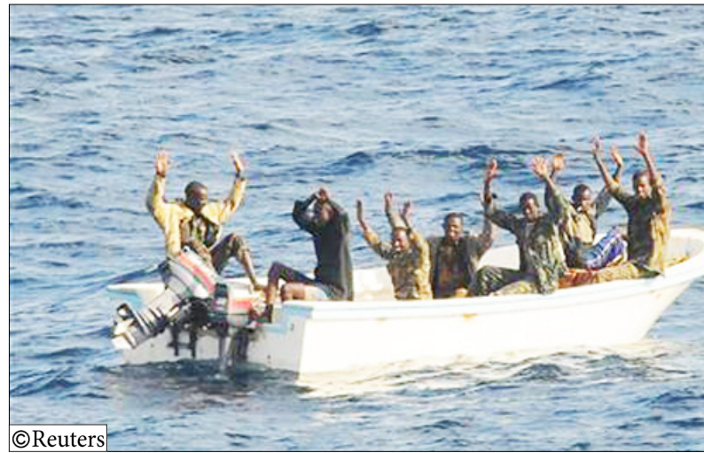
مجموعة من القراصنة في خليج عدن