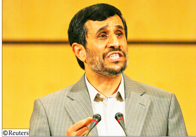
الرئيس الإيراني أحمدني نجاد يلقي خطابا في مؤتمر العنصرية أمس