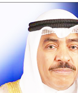
عن / صحيفة (السياسة) الكويتية

الاجتماع الاسبوعي لمجلس الوزراء إن المجلس وافق أيضاً على مشروع مرسوم بالقانون بشأن اعتماد شهادة الجنسية الأصلية بدلاً من البطاقة الانتخابية للتحقق من شخصية الناخب وتمكينه من الإدلاء بصوته لانتخابات أعضاء مجلس الأمة بعد وجود اسمه في جدول الانتخاب.