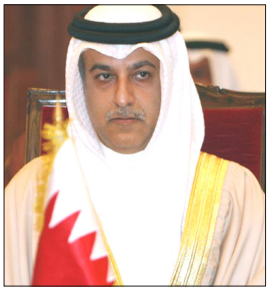
الشيخ سليمان بن إبراهيم

التصويت لاختيار مرشحي القارة إلى المكتب التنفيذي للاتحاد الدولي سيجري يوم 8 مايو المقبل في كوالالمبور بماليزيا.