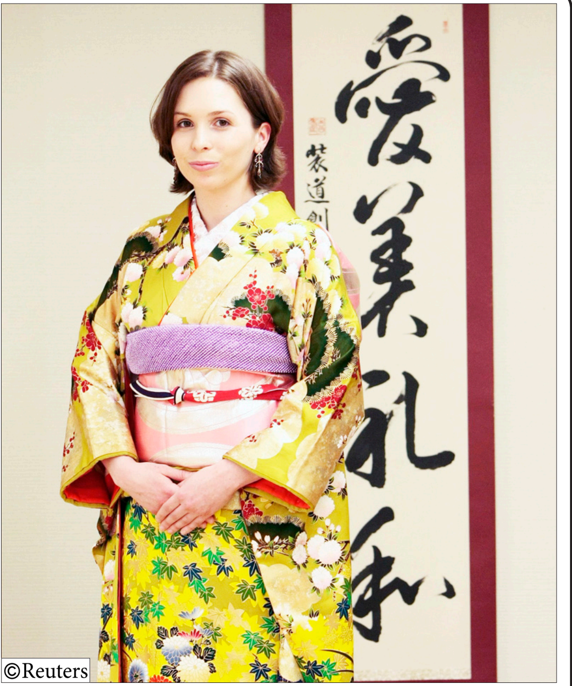
الأميرة الأردنية (ريا) تظهر باللباس الياباني التقليدي المسمى «كيمونو» لدى زيارتها أكاديمية كيمونو للأزياء في طوكيو باليابان يوم أمس.

□ عدن / نعمت عيسى : نعى اتحاد الأدباء والكتاب اليمنيين فرع عدن بكافة أدبائه وكتابه الأديب الشاعر محمد نعمان الشرجبي الذي وافته المنية في يوم الجمعة الماضي. وبهذا المصاب الجليل أعلنت سكرتارية فرع الاتحاد عن تقبل التعازي بالبلغفور له ابتداء من يوم الأحد الماضي وحتى يومنا هذا.