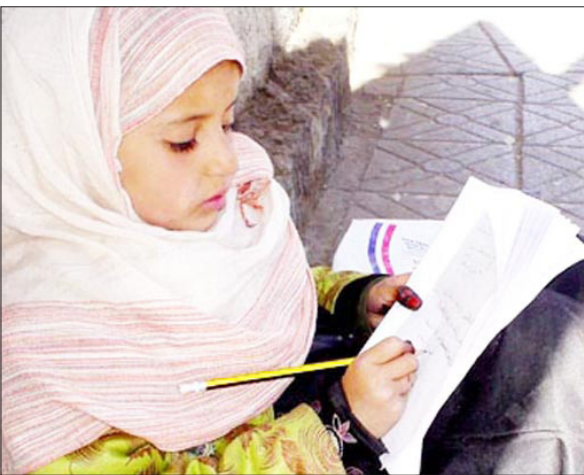
فائدة ولا تصيف للطلاب شينا.

لا يوجد أي طالب ليس لديه كتاب بالرغم من أننا نعاني من سوء استخدام الكتب من بعض الطلاب