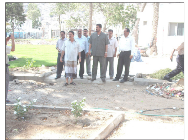
إثناء زيارة المحافظ لنادي وحدة عدن