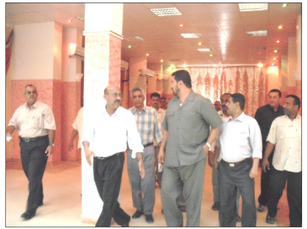
إثناء زيارة المحافظ لنادي الميناء

وعد الأخ المحافظ بالتواصل مع قيادة نادي الميناء لحل ومعالجة عدد من القضايا المطروحة التي تهم النادي. ومن ثم قام الأخ الدكتور / عدنان الجفري محافظ عدن بالنزول إلى نادي