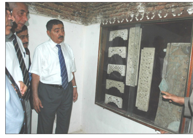
زيد / سبأ: زار رئيس مجلس الشورى عبد العزيز عبدالغني أمس ومعه نائب رئيس مجلس النواب أكرم عبد الله عطية مدينة زيد التاريخية وتفقد أعمال التطوير والتأهيل لعدد من المواقع والمرافق التاريخية بالمدينة.