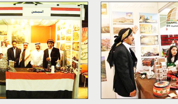
أنواع العسل اليمني المعروف كـ "عسل السدر وعسل الزهور الجبلية وعسل السمير" ... وقدمت القرية اليمنية العديد من العروض والفعاليات والرقصات الفلكلورية اليمنية المعروفة وعروض الأزياء والتي لاقت استحسان الكثيرين. كما قدم القسم اليمني عرضاً شعبياً رائعاً بعنوان "اليمن أصل العروبة" حيث ازداد حماس الجمهور وتفاعل مع الشعر

□ صنعاء / ثائر الشرعبي: شاركت الجالية اليمنية - التي اعتادت المشاركة لتمثل اليمن في كافة المهرجانات - في مهرجان القرية الثقافية الثاني 2009م حيث دعت جامعة قطر طلاب الجالية اليمنية إلى المشاركة وفرت الأرضية الخصبة لإنجاح هذا المهرجان. وشاركت العديد من الجاليات العربية والأجنبية في القرية ومن بينها اليمن. واشتملت القرية اليمنية على العديد من العروض، وتوعدت ما بين آرت مصور حيث عرض الطلاب الصور الفوتوغرافية المتنوعة التي تبين جمال الطبيعة الساحرة في اليمن بها جانب وروعة الفن المعماري اليمني ودقة الصنعة التي تتميز بها الإنسان اليمني منذ الأزل، إلى جانب الآرث الجسم، (على شكل مجسمات معمارية تشتهر اليمن فيها) كما عرض القسم اليمني الخناجر والجنابي بأشكالها وبزخرفاتها الرائعة والمتنوعة والمرصعة بتلك الأحجار الكريمة. وقد تم عرض الكثير من تلك الأحجار الكريمة والعقيق اليمني الأصيل، والحلي الرائعة التي تزين بها المرأة اليمنية وتنفرد بها دون غيرها من النساء. لم تتوقف المشاركة اليمنية على ذلك فحسب، فقد عرض القسم اليمني الكثير من المأكولات الشعبية التي تشتهر بها الكثير من المناطق في اليمن وقد لاقت استحسان الكثيرين