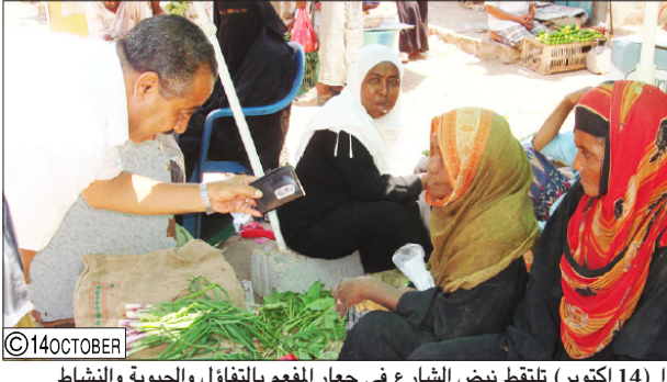
كاميرا (14 أكتوبر) تلتقط نبض الشارع في جعار المغم بالفتاوى والحبوية والنشاط