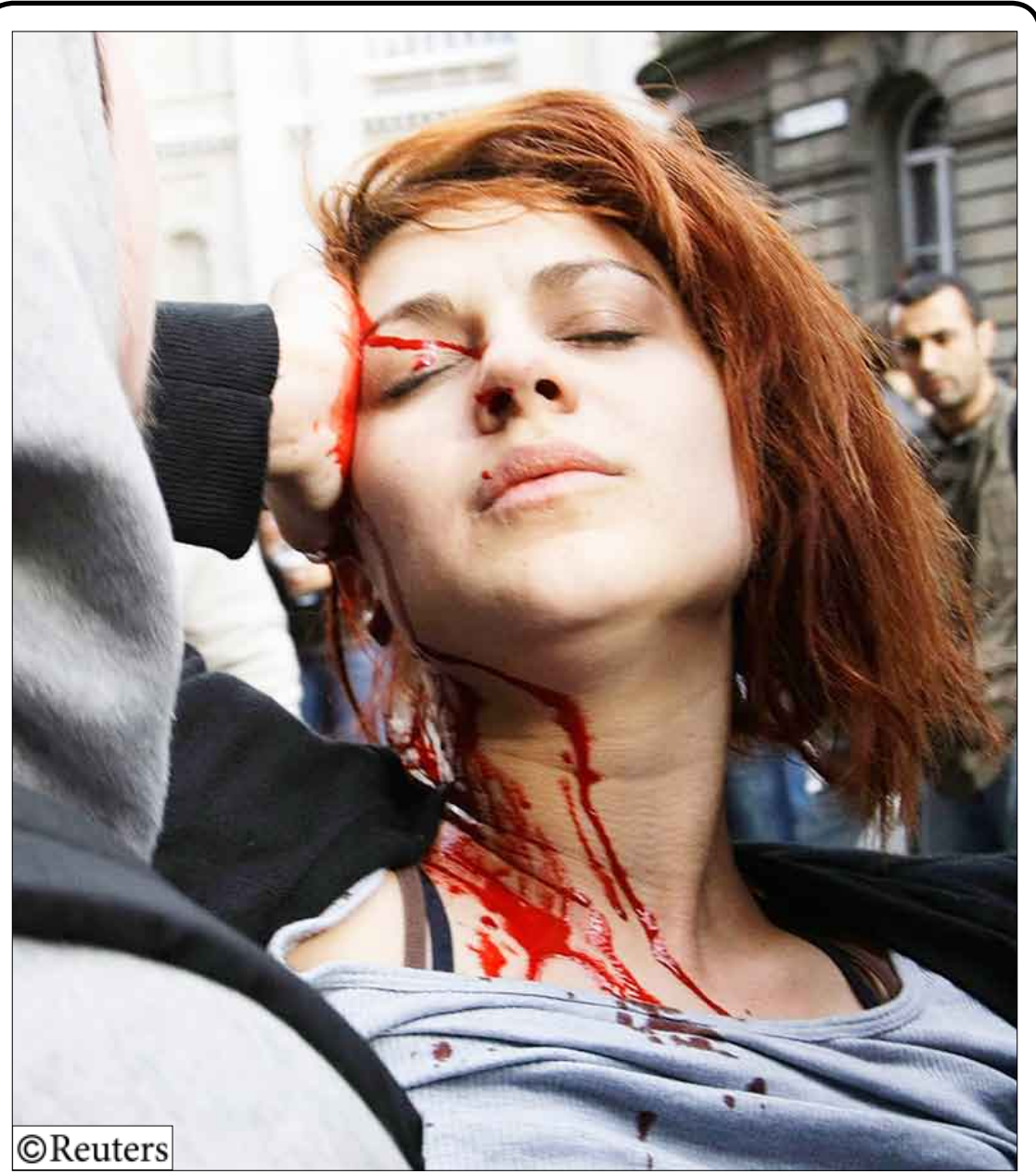
مظاهرة بريطانية جريزة خلال المظاهرة المناهضة لقمعة العشرين التي اختتمت أمس في لندن ، حيث طالب المظاهرون المحتجون بتعديل النظام المالي الرأسمالي العالمي وإلغاء وحشية العولة للإنسانية.