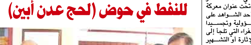
محافظ لحج يطالع على الأعمال الاستكشافية للنفط في حوض (لحج عدن أبين)

بطرف ما دون مراعاة لايسط قواعد العمل الصحفي وضرباً بعرض الحائط بقدمية هذه المهنة الإنسانية التي تفرض على العاملين فيها التزام الدقة والموضوعية والصدق والوضوح والبعد عن الفبركات ونشر الأكاذيب والاشاعات .