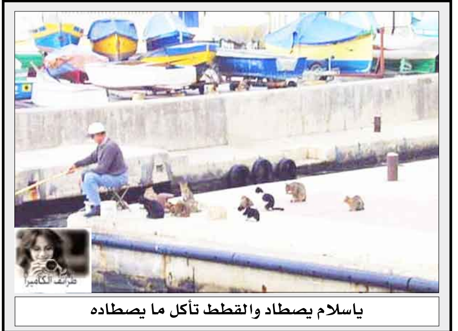
ياسلام يصطاد والقطط تاكل ما يصطاده