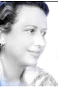
الشاعرة السورية هيفاء فويتي