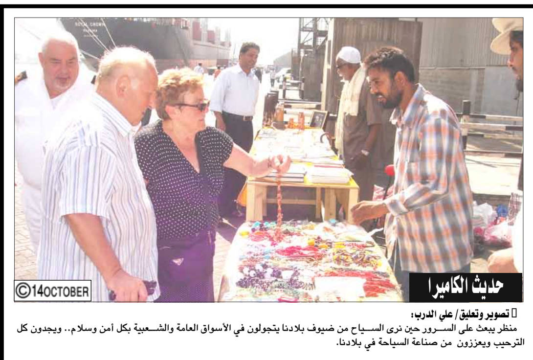
تصوير وتعليق علي الدرب: منظر بيعت على السرور حين نرى السياح من ضيوف بلادنا يتجولون في الأسواق العامة والشعبية بكل أمن وسلام.. ويجدون كل الترحيب ويعززون من صناعة السياحة في بلادنا.