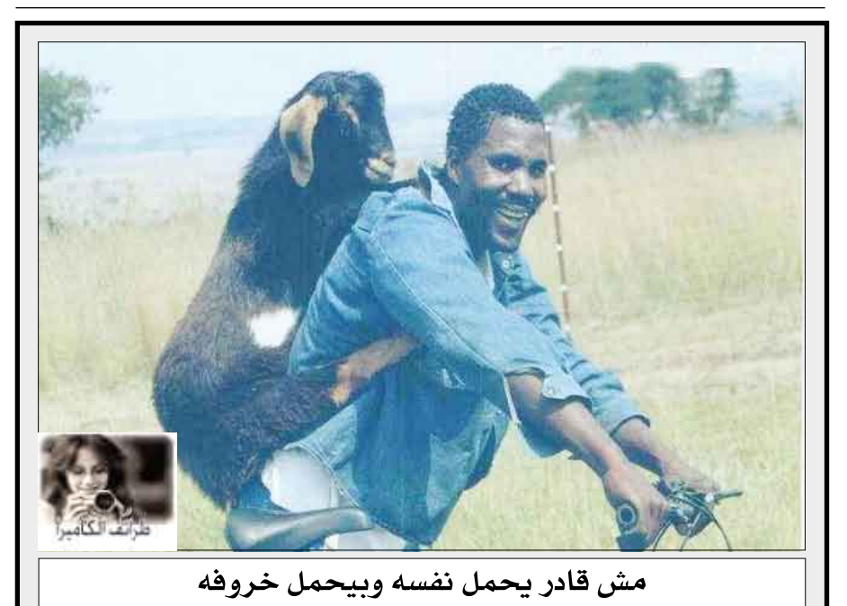
مش قادر يحمل نفسه ويحمل خروفه

أفقياً: بحار إنكليزي راد سواحل كندا القطبية مات في رحلة بحث عن طريق يؤدي إلى الشمال الغربي عام 1847م. تتألق في مشيته - حرف موسيقي - حجر كريم. حيوان أسطوري - طين رقيق. أحد الأندباء عليهم السلام - عبيد. قهوة - مدينة في تركمانستان - ارتفاع البحر. شهر هجري - أحرف مكررة - شهد. حشرات ضارة بالزروع - غطاء الزهر - اللعبة. محافظة يمنية - بحر - شك. حرف جر - هواة عليل - غطى وغلب. لص - مدينة مغربية. اتجاه جانبي - درب - للتخيير. حيوان - من الثمار - خراب. عمودياً: مخترع آلة الطباعة عام 1456م - بيت الأسد. دام ولم ينقطع - وادي على حدود اليمن والسعودية - مادة قاتلة.