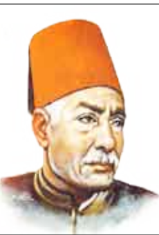
شاعر النيل حافظ إبراهيم

الأم مدرسة أعدتْها أُمٌّ مَدْرَسَةً إِذَا أَعَدَّتْ شَعْبًا طَيِّبَ الأَعْرَاقِ الأمُّ رَوْضٌ تَعَهَّدُ الحَيَاةَ بِالرِّيِّ أَوْرَقٌ أَيَّمَا إِيْرَاقِ الأمُّ أُسْتَاذٌ الأساتذة الألى شَعَلَتْ مَاتِرْمُومُ مَدَى الأَفَاقِ