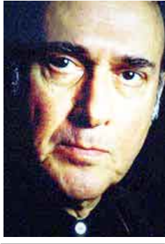
الشاعر البريطاني هارولد بنتر