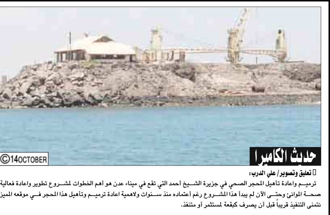
حدث الكاميرا ترميم وإعادة تأهيل المحجر الصحي في جزيرة الشيخ أحمد التي تقع في ميناء عدن هو أهم الخطوات لمشروع تطوير وإعادة فعالية صحة الموانئ وحتى الآن لم يبدأ هذا المشروع رغم اعتمادته منذ سنوات ولاهمية إعادة ترميم وتأهيل هذا المحجر في موقعه المميز لتنفيذ قريبا قبل أن يصرف كبقعة لمستثمر أو متنفذ.