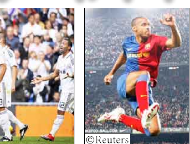
إلى داخل الرمي.