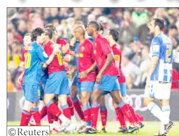
إلى داخل الرمي.

وأضاف هانتيلار مهاجم منتخب هولندا المنقل لريال مدريد مطلع العام الجاري الهدف الثالث بعد متابعة لكرة أنقدها دييجو حارس الميريا من تسديدة للهولندي الآخر اربن روبن. وفي لقاء آخر استعاد بلنسية نعمة الانتصارات بعدما حقق فوزه الأول في سبع مباريات بالمسابقة بالتغلب على صنيغفة رينسن سانتندر بهدف مقابل لا شيء. فوز برشلونة بسداسية اكتسح برشلونة منافسه ملقة بعد ان سجل أربعة أهداف في الشوط الأول عن طريق تشابي وليونيل ميسي وتيريري هنري وصمويل ايتو في الدقائق 19 و25 و32 و43. وأضاف دانييل فيس الهدف الخامس في الدقيقة 51 قبل ان يحتتم ايتو مهرجان الأهداف بعد ست دقائق ليرفع رصيده إلى 25 هدفاً في صدارة هدافي المسابقة.