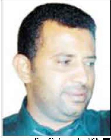
الكاتب المسرحي / فكري قاسم