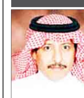
محمد بن عبد اللطيف آل الشيخ