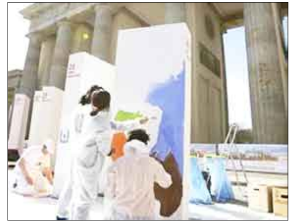
فنانون يزينون الواجه دومينو ضخمة أمام بوابة براندنبورج في برلين

برلين / 14 أكتوبر / رويترز، يعزم سكان برلين هدم مجموعة من قطع الدومينو العملاقة التي سترص على امتداد كيلومترين بطول مسار الجدار الذي كان يفصل ذات يوم شرقي ألمانيا الشيوعي عن غربها وذلك بمناسبة مرور عشرين عاماً على انهيار سور برلين. وقال كلاوس فويفرايت رئيس بلدية برلين «نريد أن نهدم الجدار مرة أخرى». ويبدأ هذا الأسبوع رص قطع الدومينو المصنوعة من مادة صناعية مرنة يزيد عددها على ألف قطعة طول كل منها 2.5 متر وارتفاعها متر واحد. وستهدم قطع الدومينو في احتفالية يجري تنظيمها في التاسع من نوفمبر القادم وهو نفس اليوم الذي شهد اقتحام سور برلين وهدمه على يد حشود من سكان ألمانيا الشرقية عام 1989. وسيقوم شبان من برلين ودول أخرى بتزيين الواجه الدومينو العملاقة بأشكال كثيرة ومختلفة.