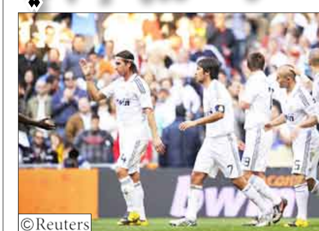
نتائج مباريات الدوري الإسباني لكرة القدم