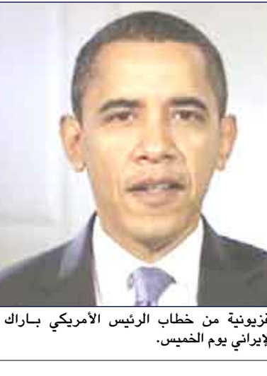
لقطة تلفزيونية من خطاب الرئيس الأمريكي باراك أوباما للشعب الإيراني يوم الخميس.

ويطالب أحمدى نجاد وانشنطن بالاستعذار عن عقود من «الجرأتم» بحق الجمهورية الإسلامية. وتفيد طهران أيضا أنه لا يمكنها أن تلتصق ما دامت القوات الأمريكية منتشرة على حدودها في العراق وأفغانستان.