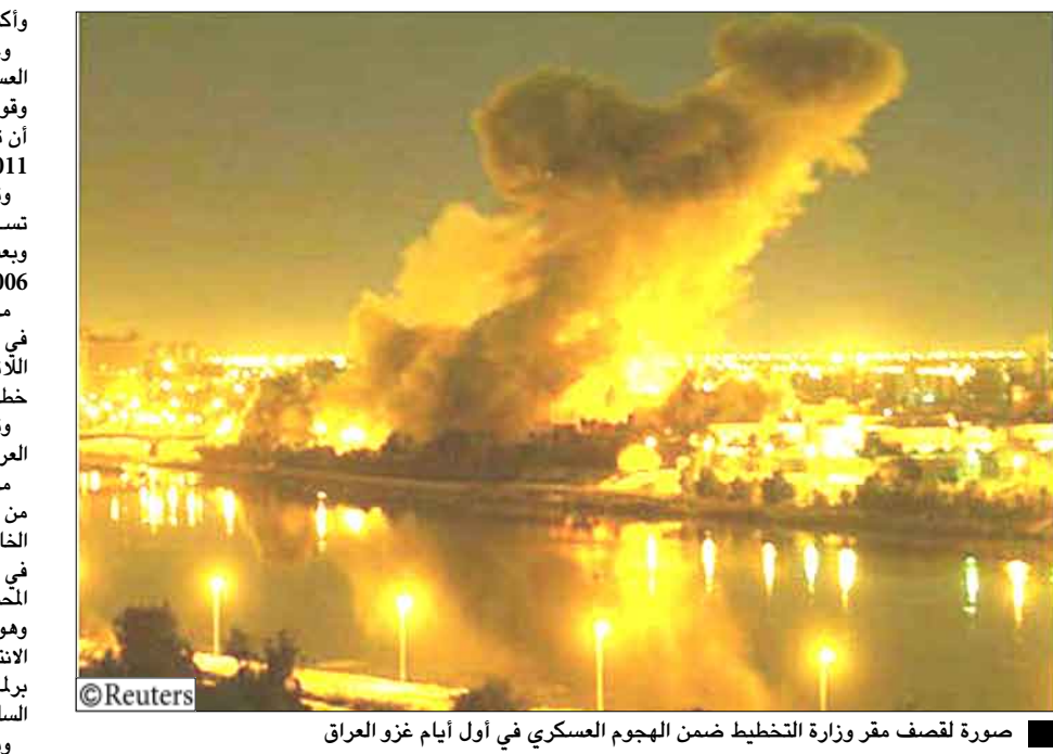
صورة لصف مفر وزارة التخطيط ضمن الهجوم العسكري في أول أيام غزو العراق

وأكثر من 15 موقعا عسكريا إلى القوات العراقية. وغادرت العراق غالبية قوات الدول التي شاركت في العملية العسكرية ولم يبق منها سوى القوات الأمريكية والبريطانية وقوات مساندة أخرى ينتظر خروجها العام الجاري، ومن المقرر أن تستكمل القوات الأمريكية انسحابها من العراق أواخر عام 2011.